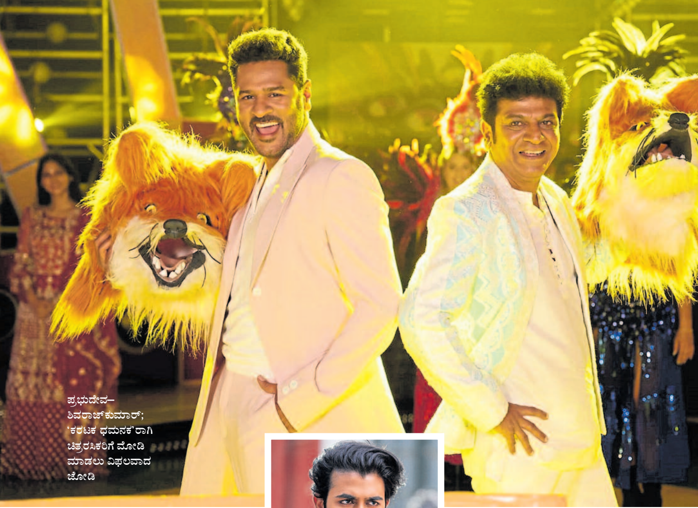
ಪ್ರಭುದೇವ್- ಶಿವರಾಜ್ ಕುಮಾರ್; 'ಕರಟಕ ಧಮನಕ' ರಾಗಿ ಚಿತ್ರರಸಿಕರಿಗೆ ಮೋಡಿ ಮಾಡಲು ವಿಫಲವಾದ ಚೋಡಿ