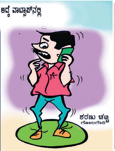
“ಅಣ್ಣ...ಈ ಬಾರಿ ರಾಖಿ ಕಳಿಸೋಕಾಣ್ಣಿಲ್ಲ! ಅದ್ದೆ ವಾಟ್ಸಾಪ್‌ನಲ್ಲ ರಾಖಿ ಕಳಿಸಿದ್ದೀನಿ...ಕಣ್ಣು ಕೋ...!”