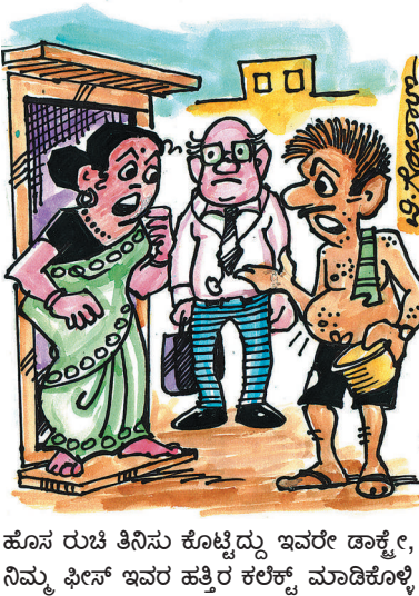
ಹೊಸ ರುಚಿ ತಿನಿಸು ಕೊಟ್ಟಿದ್ದು ಇವರೇ ಡಾಕ್ಟರ್, ನಿಮ್ಮ ಫೀಸ್ ಇವರ ಹತ್ತಿರ ಕಲೆಕ್ಟ್ ಮಾಡಿಕೊಳ್ಳಿ