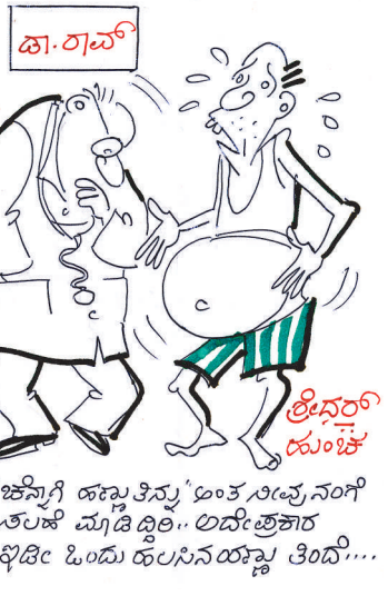
ಜಿನ್ನಾಗಿ ಹಣ್ಣು ತಿನ್ನು' ಅಂತ ಸೀವೆ ನಂಗಿ ಶಲಹೆ ಮ್ಯಾಡಿ ಡ್ವಿಲಿ... ಅದೇ ತ್ರಿಕಾರ ಭಿಡೀ ಓಂದು ಹುಲಸಿನ ಯಣ್ಣು ತಿಂದಿ....