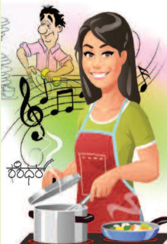
ಗಂಡ ರುಬ್ಬುಗುಂಡಿನ/ಪಾಕತ್ರೆಯಗಳ ಹಿನ್ನೆಲೆ ಸಂಗೀತ ಒದಗಿಸುವಾಗ.