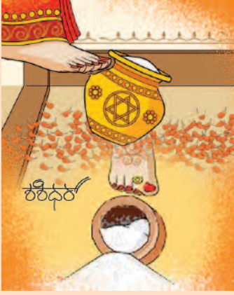
ಬತ್ತದ ಸಿರಿ ಮನೆಯಲ್ಲೆಲ್ಲ ಹರಡಲಿ ಎಂದು.