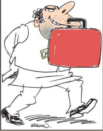
ಪಿಎಂಗಳ ಮೂಲಕ ಲಂಚವ್ಯವಸ್ಥೆಯಾಗುತ್ತದೆ!