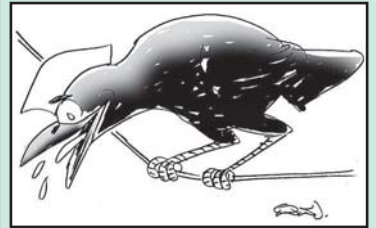
ಹೆದರಬೇಡಿ, ನಾನಿದ್ದೇನೆ ಎಂದನೊಬ್ಬ ರಾಜಕಾರಣಿ!