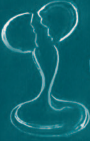
ಎಗ್ ವೈಟ್ ಪ್ರೋಟೀನ್