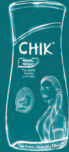
ಚಿಕ್ ಎಗ್ ವೈಟ್ ಪ್ರೋಟೀನ್ ಶ್ಯಾಂಪೂ