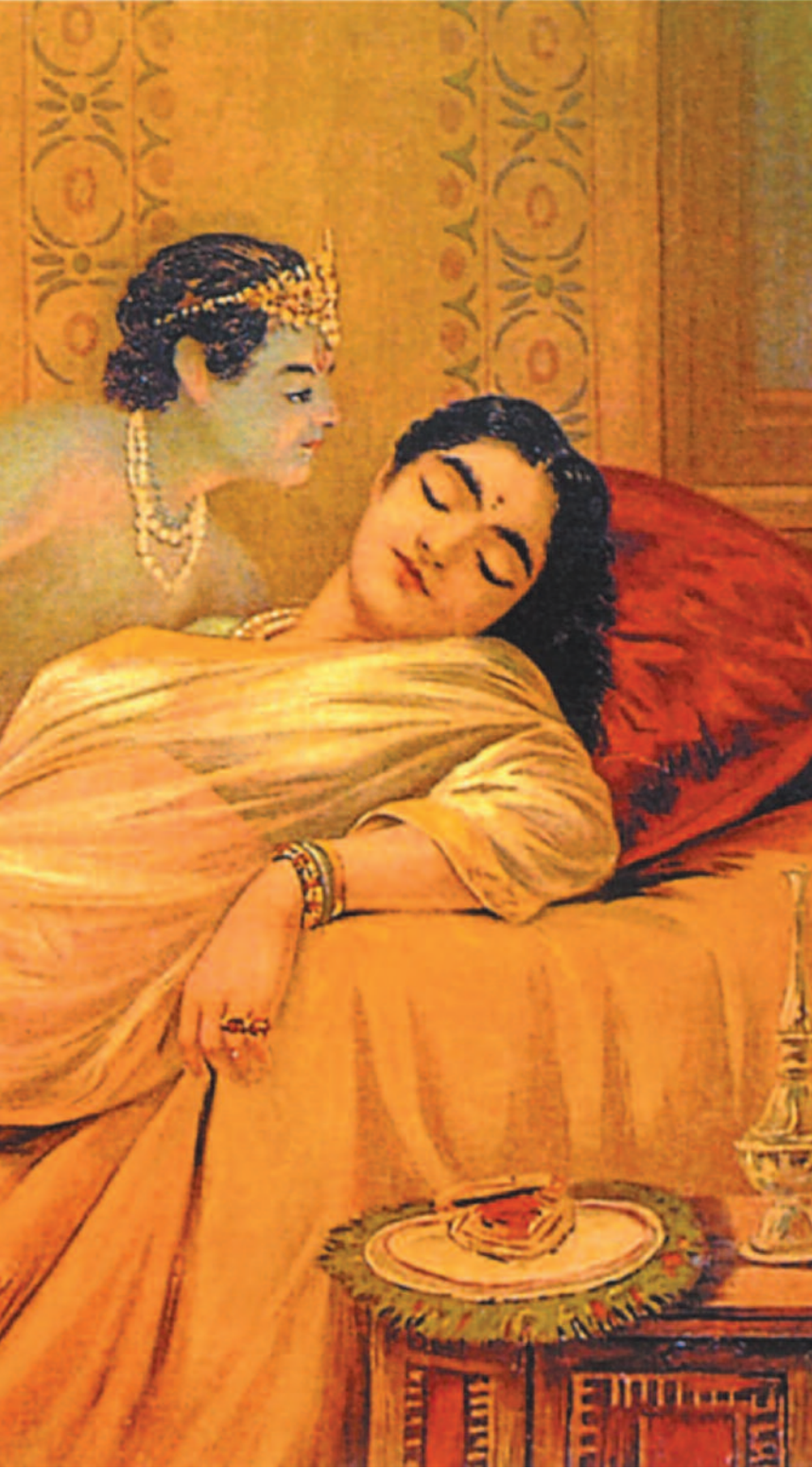
ರಾಜಾ ರವಿವರ್ಮನ ಕಲ್ಪನೆಯಲ್ಲಿ ಕನಸಿನ ಲೋಕದಲ್ಲಿ ವಿಹರಿಸುತ್ತಿರುವ ಉಷಾ ಕಲಾಕೃತಿ ಕೃಪೆ: 'ಪರಸರಾಮ್ ಮಂಘಾರಾಮ್' ಪ್ರಕಾಶನದ 'ರಾಜಾ ರವಿವರ್ಮ: ದಿ ಪ್ಯೆಂಟರ್ ಪಿನ್ಸ್'