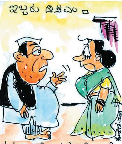
ನಮ್ಮ ಚಾಳಿ ಒಪ್ಪಿಸುವಷ್ಟು ಚಾಲ್ತಿ ಇದ್ದಿಲ್ಲೆ ನಾನು ಯಾರನೇ ಇತ್ತೀಕಿಂ ಕೊಡುತ್ತೇನೆ..!