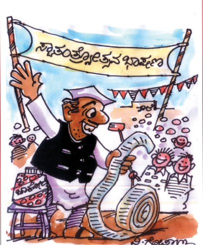
ಮಕ್ಕಳಿಗೆ ನನ್ನ ಭಾಷಣವನ್ನು ಕೊನೆತನಕ ಕೇಳಿಸುವ ರೀತಿ ಇಂಥೊಂದು ಇಂಥೊಂದು ಕೊಡುತ್ತೇನೆ..!