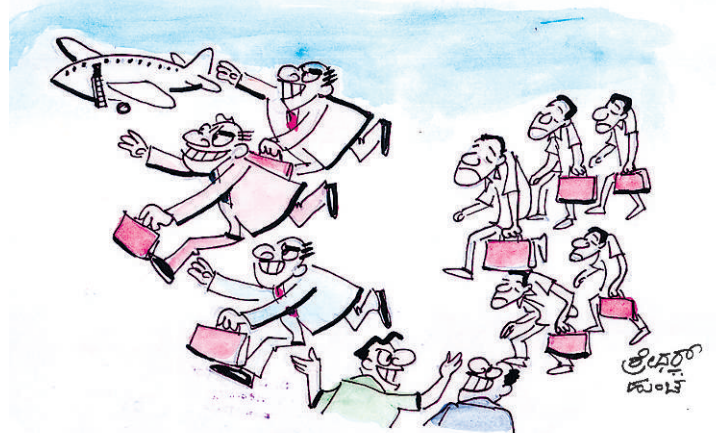
ಮುಂದೆ ಓಡಾಡಿ ಜೀವಿಗಳು ಬಂದವೆ ಒಲಂಪಿಕ್ಸ್‌ಗೆ ಹೋಗುವ ಶ್ರೀಡ್ಡಾ ಅಧಿಕಾರಿಗಳು.. ಯಿಂಥೆ ಕಾಲ್ ಕೊಡು ಕೊಂಡು ಬಂದಾ ಇವೆಂರು ಅಭಿಚಾರಿಗಳು..!!