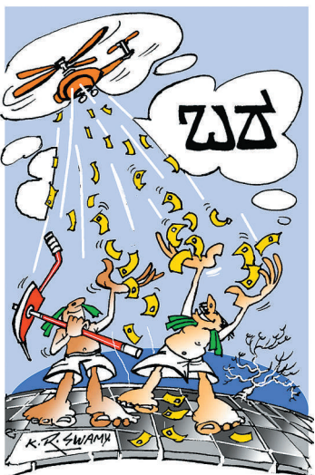
ಮೋಡ ಬಿತ್ತಿ... ಮಳೆ ಬಂದು... ಬೆಳೆ ಬೆಳೆದು... ಅದನ್ನೆಲ್ಲಾ ಮಾರಿ... ಇವೆಲ್ಲಾ ಯಾತಕ್ಕೆ ಬೇಕು?