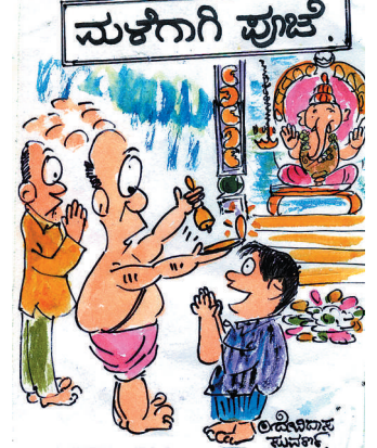
ಶಾಲೆಗೆ ರಜೆ ಕೊಡುವಂತಹ ಮಳೆ ಬೀಳುವಂತೆ ಪುಜೆ ಮಾಡಿ ಪೂಜಾರಿಗಳೆ..!