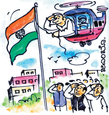
ತುರ್ತಾಗಿ ಹೈಕಮಾಂಡ್ ಭೇಟಿಗೆ ಹೊರಟಿದ್ದಾರಂತೆ, ಅಲ್ಲಿಂದಲೇ ಧ್ವಜಾರೋಹಣ ಮುಗಿಸಿದ್ದಾರೆ!