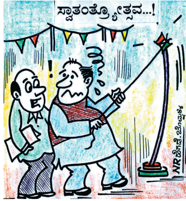
ಜೋರಾಗಿ ಜಗ್ಗಿ ಸಾರ್... ಭಿನ್ನಮತದ ಸಮಸ್ಯೆ ಥರಾ ಇದೂ ಕಗ್ಗಂತಾಗಿ ಬಿಟ್ಟಿದೆ.. ಅನ್ನುತ್ತೆ..!