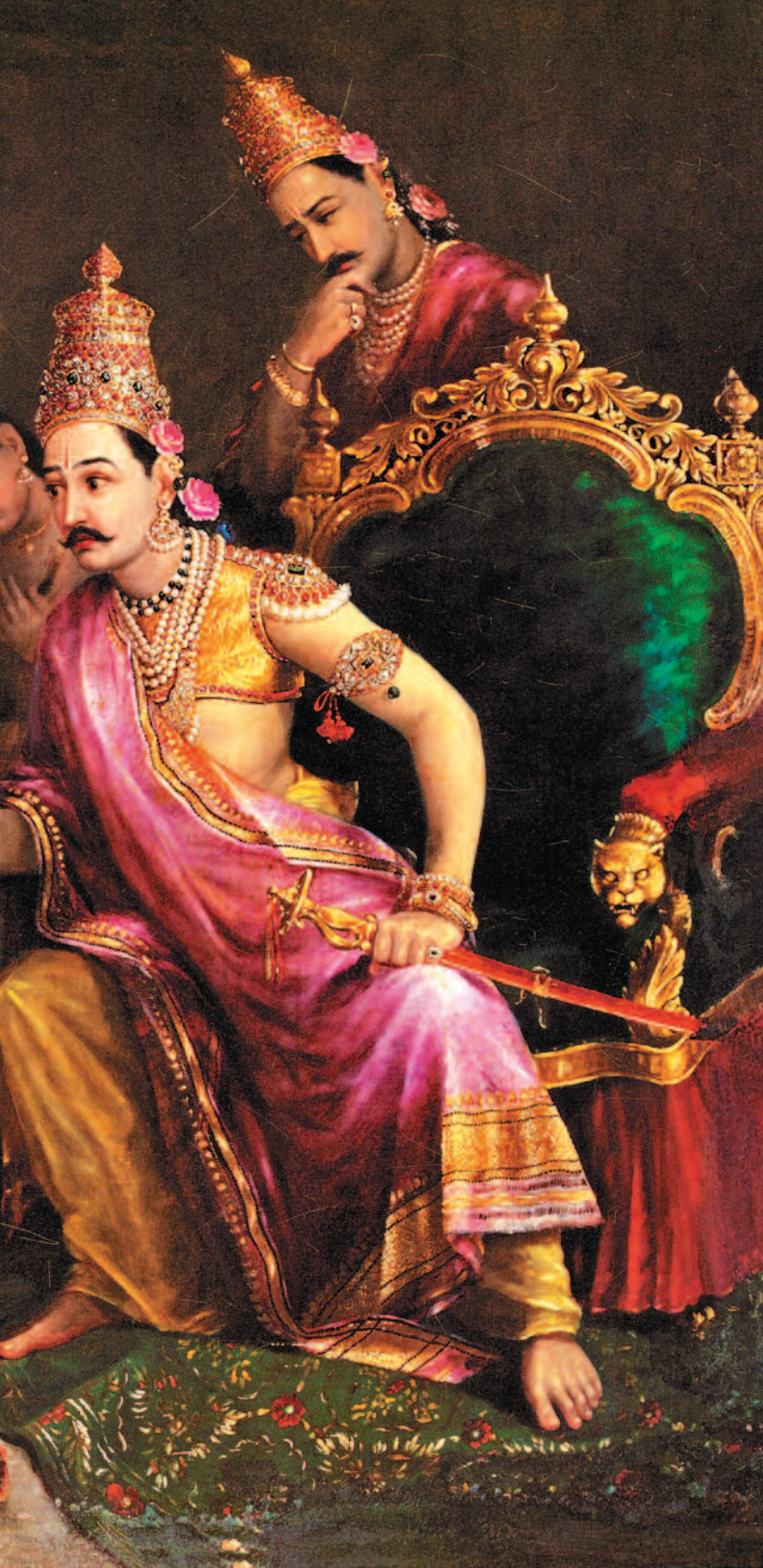
ರಾಜಾ ರವಿವರ್ಮನ ಕಲ್ಪನೆಯಲ್ಲಿ ಸೀತಾದೇವಿಯಿಂದ ಭೂಮಿ ಪ್ರವೇಶ ಕಲಾಕೃತಿ ಕೃಪೆ: 'ಪರಸರಾಮ್ ಮಂಘಾರಾಮ್' ಪ್ರಕಾಶನದ 'ರಾಜಾ ರವಿವರ್ಮ: ದಿ ಪ್ಯೆಂಟರ್ ಪ್ರಿನ್ಸ್'