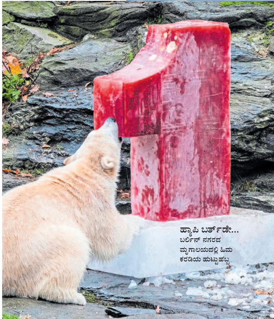
ಹ್ಯಾಪಿ ಬರ್ತ್‌ಡೇ... ಬರ್ಲಿನ್ ನಗರದ ಮೃಗಾಲಯದಲ್ಲಿ ಹಿಮ ಕರಡಿಯ ಹುಟ್ಟುಹಬ್ಬ