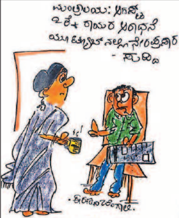
ಸದ್ಯಕ್ಕೆ ಮನೆಯೇ ಮಂತ್ರಾಲಯ ಕಣೋ...