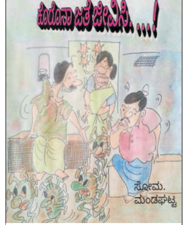
ನಮ್ಮ ಮನೆಯವಳ ಬಾಯಿಗೆ ಹೆದರಿ ಮನೆಯೊಳಗೆ ಯಾರೂ ಇರೋದಿಲ್ಲ ಕಣೋ!