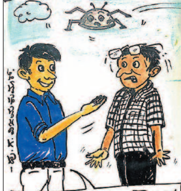
ನಿಂದೆಲ್ಲಾ ಉತ್ತರನ ಪೊಸುಪ್ಪ ನನ್ನ ಮುಂಡೆ, ನಿನ್ನ ಸ್ಪೋನ್ ತ್ರುತಾವ ನಡೆಯಲ್ಲಾ.