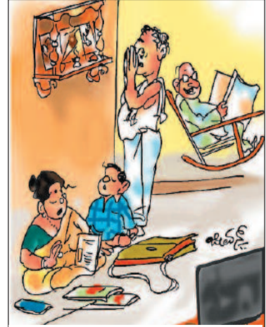
ಮನೆಯೇ ಮಂತ್ರಾಲಯ ಆಗಿತ್ತು. ಈಗ ಮನೆಯೇ ಆನ್‌ಲೈನ್ ವಿದ್ಯಾಲಯವೂ ಆಗಿದೆ!