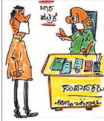
ತಾವು ಮಾಡುವ ಕಾರ್ಪೊನ್‌ಗಳಿಗೆ ತಪ್ಪದೇ ಮಾಸ್ಕ ಹಾಕುವಂತೆ ಎಲ್ಲ ಕಾರ್ಪೊನಿಸ್ಟ್‌ಗಳಿಗೆ ತಿಳಿಸಿ.