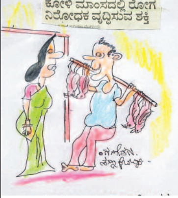
ನೀನೇ ಹೇಳಿದೆಯಲ್ಲ ರೋಗ ನಿರೋಧಕ ಶಕ್ತಿ ಹೆಚ್ಚಿಸುವ ಆಹಾರ ಪದಾರ್ಥ ಜಾಸ್ತಿ ತಗೊಂಡು ಬನ್ನಿ ಅಂತ ತಂದಿದ್ದೀನಿ ತಗೋ...