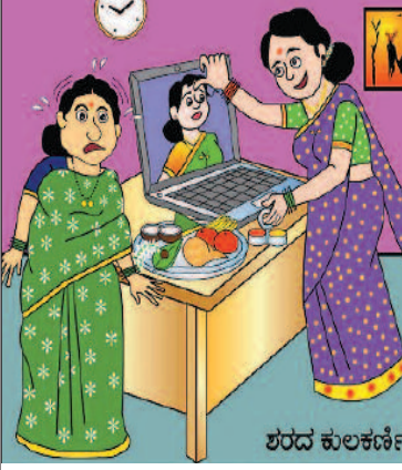
ಕೊರೊನಾ ಭಯದಿಂದ ಯಾರೂ ಮನೆಗೆ ಬರಲ್ಲ ಅಂತ ವರಮಹಾಲಕ್ಷ್ಮಿ ಬಾಗಿವನ್ನು ಆನ್‌ಲೈನ್‌ನಲ್ಲಿ ಕೊಡುತ್ತಿದ್ದೇನೆ ಅತ್ತೆ...