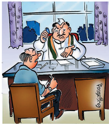
ನಿನ್ನೆ ನಾನು ಮಾಡಿದ ಭಾಷಣದಲ್ಲಿ ಅದು ಏನು ಬರೆದಿದ್ದಿ? ಯಾವುದೋ ಹೇಳಿಕೆಯಿಂದ ದೊಡ್ಡ ವಿವಾದ ಆಗಿದೆ ಅಂತ...!