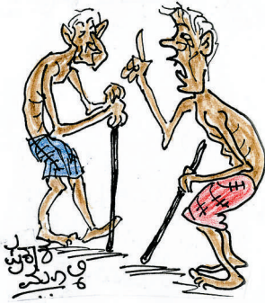
ಕ್ರಿಕೆಟ್ ಆಟಗಾರರು ಶತಕ ಗಳಿಸಿದರೆ ಜನ ಅವರಿಗೆ ಎಷ್ಟೊಂದು ಮರ್ಯಾದೆ ಕೊಡುತ್ತಾರೆಲ್ಲೆ?