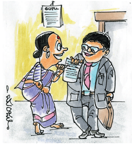
ಟ್ರಾನ್ಸ್‌ಫರ್ ಸಿಕ್ತಾ? ಎಷ್ಟಕ್ಕೆ ಆಯ್ಕುರೀ?

ಅಕ್ಷರ ವ್ಯವಸ್ಥೆಯು - ಕಲಾವಿದ, ಕೃಷಿ ಸಂಶೋಧಕರು ಒಬ್ಬ ಉಪಯೋಗಿಸಿಲ್ಲ..