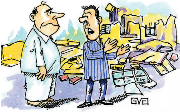
ಇದು ಭೂಕಂಪ ಪೀಡಿತ ಪ್ರದೇಶ ಅಲ್ಲ ಸಾರ್, ಕರೆಯ ಒತ್ತುವರಿ ತೆರವುಗೊಳಿಸಿರುವ ಪ್ರದೇಶ!