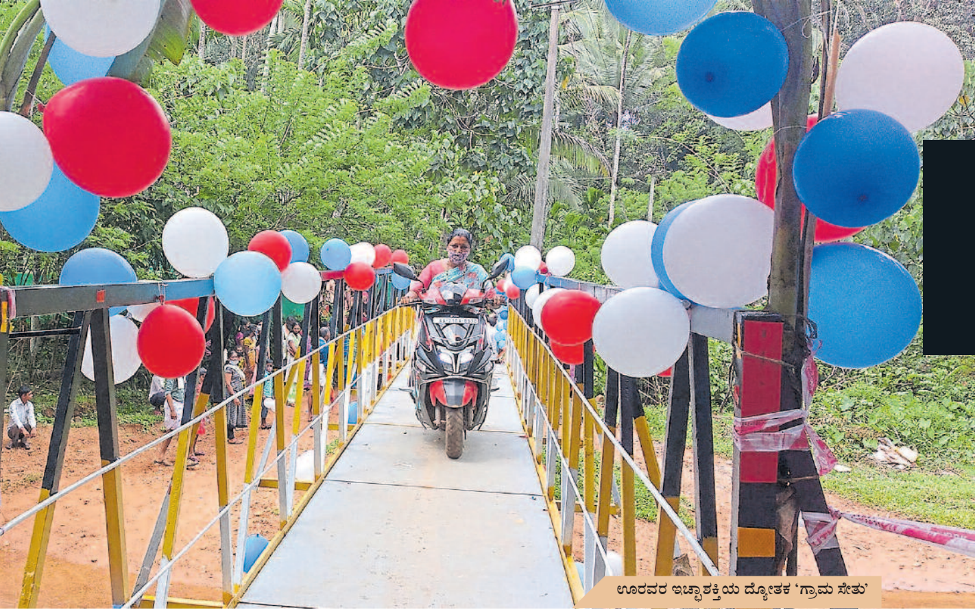
ಊರವರ ಇಚ್ಛಾಶಕ್ತಿಯ ದ್ಯೋತಕ 'ಗ್ರಾಮ ಸೇತು'

ಮಂದಿಯ ತಂಡವು ಸಶಕ್ತವಾಯಿತು. ಸದಸ್ಯರ ಸಂಖ್ಯೆ ಏರಿತು. ಪ್ರತಿ ಮನೆಗಳ ಭೇಟಿ. ಮನೆಯವರೊಂದಿಗೆ ಮನೆಯವರಾಗಿ ಮಾತುಕತೆ. ಊರಿನ ಅವಶ್ಯಕತೆಗಳನ್ನು ಮನದಟ್ಟು ಮಾಡುವ ಕೆಲಸಗಳು ನಡೆದುವು. ಇದು ನಮಗೋಸ್ಕರ ಹೋರಾಟ, ನಮ್ಮ ಹಳ್ಳಿಯ ಉದ್ಧಾರಕ್ಕಾಗಿ ಆಂದೋಲನ. ರಾಜಕೀಯ ಲಾಭಕ್ಕಲ್ಲ - ಘೋಷಣೆಯು ಮನಸ್ಸುಗಳನ್ನು ಬಂಧಿಸಿದುವು.