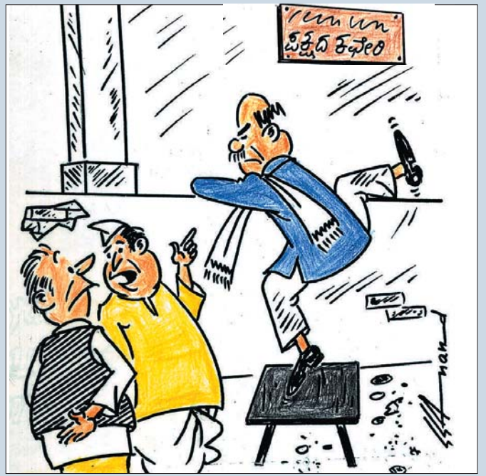
ಅವು ಒಳಗೆ ಬರುವುದೇ ಹೀಗೆ.. ಅಧ್ಯಕ್ಷರು ಬದಲಾಗೋವರೂ, ಕಚೇರಿ ಮೆಟ್ಟು ತುಳಿಯೋದಿಲ್ಲವಂತೆ!