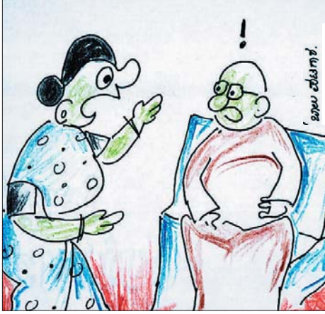
ಸುಮ್ಮನೆ ಹೋಗಿ ಉಟ ಮಾಡಿಕೊಂಡು ಬರುವುದಾದ್ರೆ, ಸಾಹಿತ್ಯ ಸಮ್ಮೇಳನಕ್ಕೆ ಹೋಗಿ, ಪುಸ್ತಕ ತರುವುದಾದ್ರೆ ಬೇಡ!