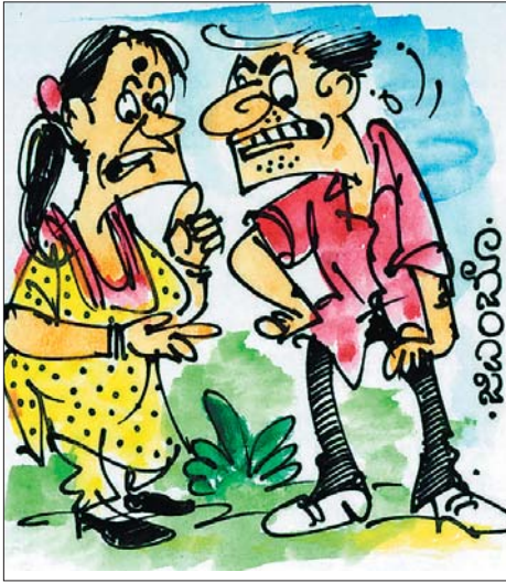
ನಿಮ್ಮ ವಯಸ್ಸಿನ ಬಗ್ಗೆ ಸುಳ್ಳು ಹೇಳಿದ್ರೂ ಚಿಂತೆ ಇಲ್ಲ, ಆದರೆ ನಿಮ್ಮ ಸಂಬಳದ ಬಗ್ಗೆ ನಿಜ ಹೇಳಲೇ ಬೇಕು