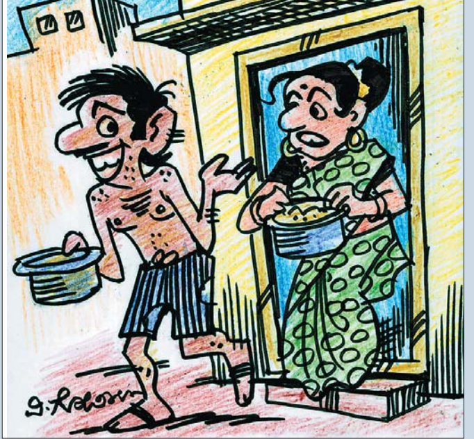
ಬೇರೆಯವರ ಮನೆ ಹೊಸರುಚಿ ತರಬೇಡಿ, ನಾನೇ ಮಾಡುತ್ತೇನೆ ಅಂತಾ ನನ್ನ ಹೆಂಡತಿ ಹೇಳಿದ್ದಾಳೆ ತಾಯಿ...