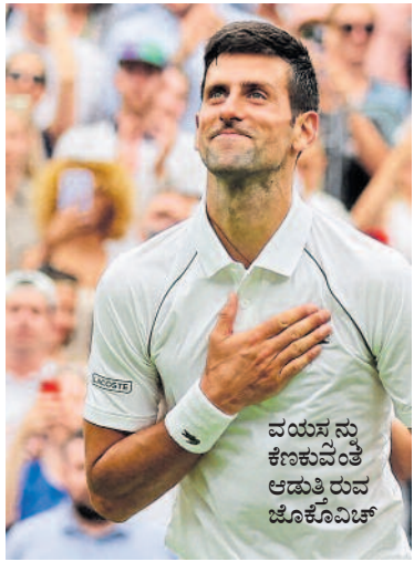
ವಯಸ್ಸನ್ನು ಕಣಕುವಂತೆ ಆಡುತ್ತಿರುವ ಜೊಕೊವಿಚ್