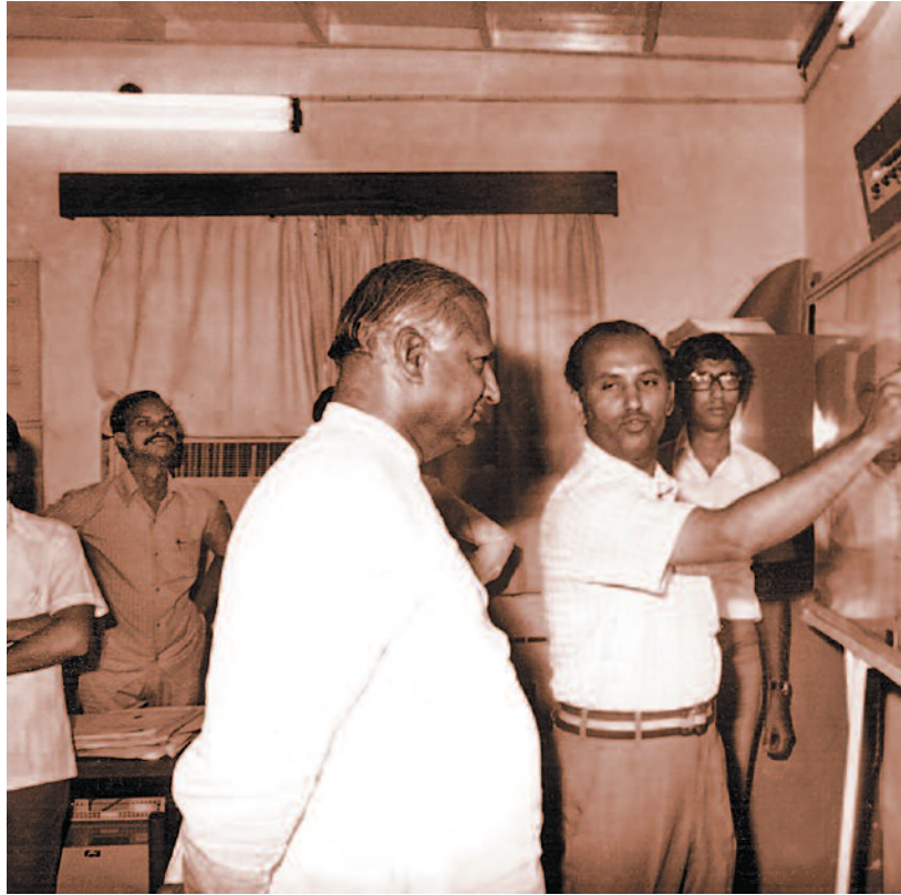
ಆಗಿನ ಮುಖ್ಯಮಂತ್ರಿ ಡಿ. ದೇವರಾಜ ಅರಸ್ ಜತೆಗೆ

ಇನ್ನೊಮ್ಮೆ, ನಾವು ನಡೆಸುತ್ತಿರುವ ಕರ್ನಾಟಕ ವೈಜ್ಞಾನಿಕ ಮನೋವೃತ್ತಿ ಆಂದೋಲನದ ಉದ್ಘಾಟನೆಯನ್ನು ಮಾಡಿ ಗಣತಂತ್ರದ ಯಶಸ್ಸಿಗೆ ಜನರಲ್ಲಿ ವೈಜ್ಞಾನಿಕ ಮನೋವೃತ್ತಿ ಇರುವುದು ಎಷ್ಟು ಅಗತ್ಯ ಎಂಬುದರ ಕುರಿತು ಹೇಳಿದ್ದರು. ಕರ್ನಾಟಕದ ಈ ಮಟ್ಟದ ವಿಜ್ಞಾನಿಗಳಲ್ಲಿ ತಮ್ಮ ಪರಿಣತ ವಿಷಯದ ಕುರಿತು ಕನ್ನಡದಲ್ಲಿ ಅಷ್ಟೊಂದು ಸುಲಲಿತವಾಗಿ ಮಾತಾಡುವ ಮತ್ತು ಮೂಢಾಚರಣೆಗಳನ್ನು ಕಟುವಾಗಿ ಟೀಕಿಸಿ ವೈಜ್ಞಾನಿಕ ಮನೋವೃತ್ತಿಯನ್ನು ಅಸ್ಥಿಲಿತವಾದ ಮಾತುಗಳಲ್ಲಿ ಪ್ರತಿಪಾದಿಸುವ ಕೆಲವೇ ಕೆಲವರಲ್ಲಿ ಯು.ಆರ್.ರಾವ್ ಒಬ್ಬರು.