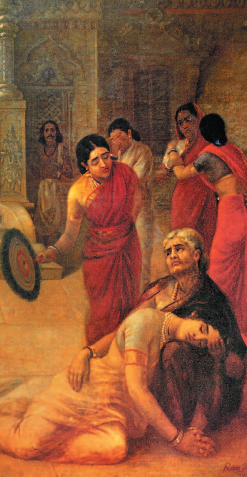
ರಾಜಾ ರವಿವರ್ಮನ ಕಲ್ಪನೆಯಲ್ಲಿ ಮೋಹಿನಿ-ರುಕ್ಕಾಂಗದ ಕಲಾಕೃತಿ ಕೃಪೆ: 'ಪರಸರಾಮ್ ಮಂಘಾರಾಮ್' ಪ್ರಕಾಶನದ 'ರಾಜಾ ರವಿವರ್ಮ: ದಿ ಪೈಂಟರ್ ಪ್ರಿನ್ಸ್'