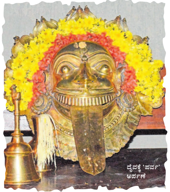
ದೈವಕ್ಕೆ 'ಪರ್ವ' ಅರ್ಪಣೆ

ಆದರೆ ಈಗ ಶೀಘ್ರ ಬೆಳೆಯುವ ತಳಿಗಳು ಬಂದಿರುವುದರಿಂದ ಶ್ರೀಮಂತ-ಬಡ ಕೃಷಿಕರೆಂಬ ಭೇದವಿಲ್ಲ. ಕೃಷಿಯೇ ಸವಾಲಾಗಿರುವುದರಿಂದ ಹಬ್ಬಗಳು ಆಧುನಿಕಗೊಂಡು ಪೇಟೆ ಶೈಲಿಗೆ ಮುಖ ಮಾಡಿವೆ.