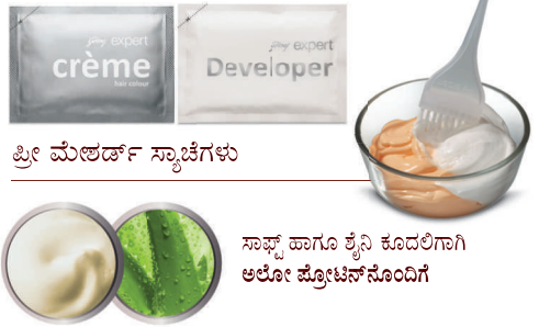
ಪ್ರೀ ಮೆಚರ್ಡ್ ಸ್ಯಾಚೆಗಳು