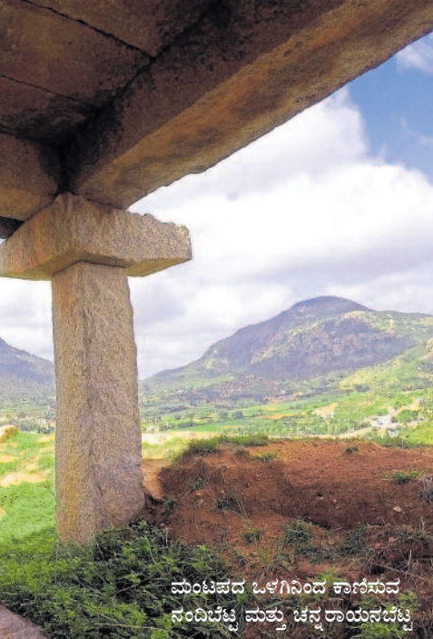
ಮಂಟಪದ ಒಳಗಿನಿಂದ ಕಾಣಿಸುವ ನಂದಿಬೆಟ್ಟ ಮತ್ತು ಚನ್ನರಾಯನಬೆಟ್ಟ

ಚರಿತ್ರೆಯಲ್ಲಿ ಅದು ರಕ್ತದ ಕಲೆಗಳನ್ನು ಮೆತ್ತಿಕೊಂಡಿರುವುದು ದಾಖಲಾಗಿದೆ. ಈ ಬಂಡೆ ಬೆಟ್ಟದ ಮೇಲೆ ಕೂರಿಸಿದ ರೀತಿಯಿದೆ. ಬಂಡೆಯ ಬಳಿ ಹೋಗಲು ದಾರಿ ಮಾಡಲಾಗಿದೆ. ಸುತ್ತಲೂ ಗೋಡೆ ಸಹ ನಿರ್ಮಿಸಿದ್ದು, ಪ್ರವೇಶಿಸಲು ಸಣ್ಣ ದ್ವಾರ ಇದೆ. ಒಳಗೆ ಒರಟಾದ ವಸ್ತುಗಳಿಂದ ನಿರ್ಮಿತವಾದ ಬಂಗಲೆಯಿದೆ. ಅದರಲ್ಲಿ ಯುರೋಪಿಯನ್ ಬಂಧಿಗಳನ್ನು ಆಗ ಆಳ್ವಿಕೆ ನಡೆಸುತ್ತಿದ್ದ ಹೈದರ್ ಮತ್ತು ಟಿಪ್ಪು ಬಂಧಿಸಿಡುತ್ತಿದ್ದರು. ಬಂಧಿಗಳ ಸಂಖ್ಯೆ ಹೆಚ್ಚಾದಾಗ ಕೆಲವರನ್ನು ಬಂಡೆಯ ತುದಿಗೆ ಕರೆದೊಯ್ದು ತಳ್ಳಿಬಿಡುತ್ತಿದ್ದರು. ಸುಮಾರು 70ರಿಂದ 80 ಅಡಿ ಎತ್ತರದಿಂದ ಬಿದ್ದು ದೇಹದ ಮೂಳೆಗಳನ್ನೆಲ್ಲಾ ಮುರಿದುಕೊಂಡು - ನರಿ, ಕತ್ತೆ ಕಿರುಬ ಮತ್ತು ಹುಲಿಗಳಿಗೆ ಆಹಾರವಾಗುತ್ತಿದ್ದರು. ನಮ್ಮ ದೇಶವಾಸಿಗಳ (ಬ್ರಿಟಿಷರ) ಹಲವರ ಹೆಸರುಗಳು ಅಲ್ಲಿನ ಗೋಡೆಗಳ ಮೇಲೆ, ಮಾಡಿನ ಮೇಲೆ ಕೊರೆದಿರುವುದನ್ನು ನೋಡಿದೆವು. ಈ ಹೈದರ್ ಮತ್ತು ಟಿಪ್ಪು ಅವರ ಇನ್ನೊಂದು ಅತ್ಯಂತ ಇಷ್ಟವಾದ ಡ್ರಾಪ್ ನಂದಿದುರ್ಗದ ಮೇಲಿದೆ. ಅದು ನನಗೆ ಈ ಸಂದರ್ಭದಲ್ಲಿ ನೆನಪಾಗುತ್ತಿದೆ. ನಂದಿದುರ್ಗದ ನೈರುತ್ಯ ಭಾಗದಲ್ಲಿ ಸುಮಾರು ಒಂದು ಸಾವಿರದಿಂದ ಒಂದು ಸಾವಿರದ ಇನ್ನೂರು ಅಡಿಗಳಷ್ಟು ಬೆಟ್ಟ ಕಡಿದಾಗಿದೆ. ಬಂಧಿಯಾಗಿದ್ದ