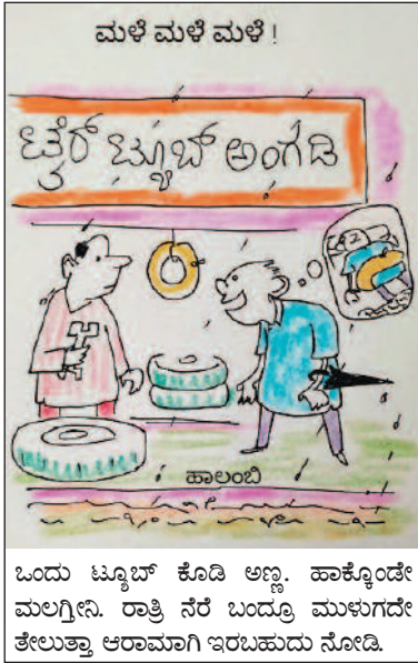
ಮಳೆ ಮಳೆ ಮಳೆ! ಒಂದು ಟ್ಯೂಬ್ ಕೊಡಿ ಅಣ್ಣ. ಹಾಕ್ಯೊಂದೇ ಮಲ್ಗ್ರೀನಿ. ರಾತ್ರಿ ನೆರೆ ಬಂದ್ರೂ ಮುಳುಗದೇ ತೇಲುತ್ತ್ತು ಆರಾಮಾಗಿ ಇರಬಹುದು ನೋಡಿ.