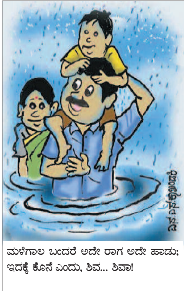
ಮಳೆಗಾಲ ಬಂದರೆ ಅದೇ ರಾಗ ಅದೇ ಹಾಡು; ಇದಕ್ಕೆ ಕೊನೆ ಎಂದು, ಶಿವ... ಶಿವಾ!