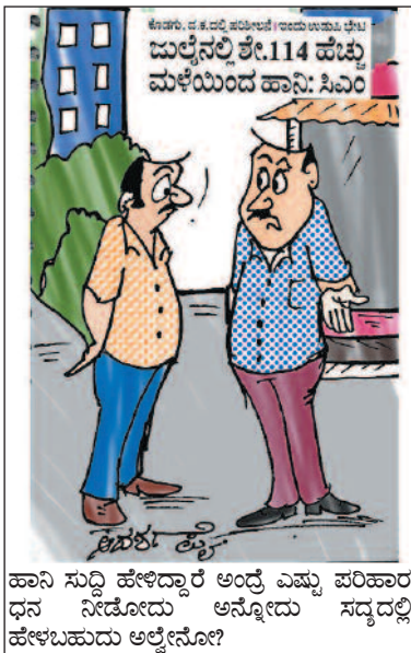
ಹಾವಿನ ಸುದ್ದಿ ಹೇಳಿದ್ದಾರೆ ಅಂದ್ರೆ ಎಷ್ಟು ಪರಿಹಾರ ಧನ ನೀಡೋದು ಅನ್ನೋದು ಸದ್ಯದಲ್ಲೇ ಹೇಳಬಹುದು ಅಲ್ಲೇನೋ?