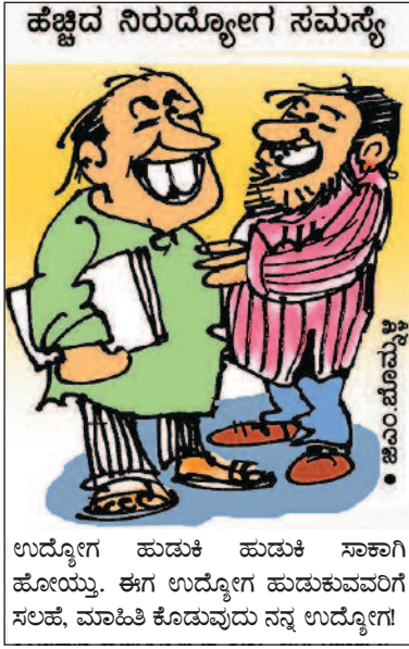
ಉದ್ಯೋಗ ಹುಡುಕಿ ಹುಡುಕಿ ಸಾಕಾಗಿ ಹೋಯ್ತು. ಈಗ ಉದ್ಯೋಗ ಹುಡುಕುವವರಿಗೆ ಸಲಹೆ, ಮಾಹಿತಿ ಕೊಡುವುದು ನನ್ನ ಉದ್ಯೋಗ!