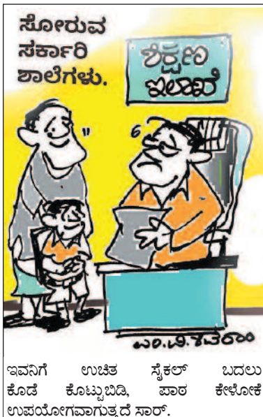
ಇವನಿಗೆ ಉಚಿತ ಸೈಕಲ್ ಬದಲು ಕೊಡೆ ಕೊಟ್ಟುಬಿಡಿ, ಪಾಠ ಕೇಳೋಕೆ ಉಪಯೋಗವಾಗುತ್ತದೆ ಸಾರ್.