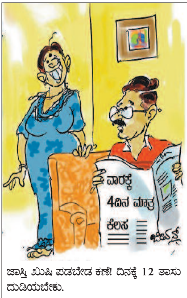
ಜಾಸ್ತಿ ಮಿಷಿ ಪಡಬೇಡ ಕಣೆ! ದಿನಕ್ಕೆ 12 ತಾಸು ದುಡಿಯಬೇಕು.