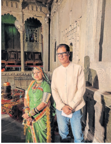
ಪ್ರವಾಸವೆಂದರೆ ಹೊಸ ಜನರ ಪರಿಚಯವೂ ಹೌದು... ಸ್ಥಳೀಯ ಮಹಿಳೆ ಜೊತೆ ಲೇಖಕರು

ಹೊರಿಸಿಯೇ ವಿರಮಿಸುತ್ತದೆ. ಆದರೆ ಗತಕಾಲದ ಚರಿತ್ರೆಯು ಎಲ್ಲ ಸಂದರ್ಭದಲ್ಲೂ ಧಾರ್ಮಿಕ ರಾಗಭಾವಗಳಿಗೆ ಉಪಕರಣವಾಗಿ ಒದಗುವುದಿಲ್ಲ. ಅದು ಯಾವ ಧರ್ಮದ ಸಂಸ್ಕೃತಿಯ ಭಾಷೆಯ ಪ್ರಭಾವ ಎಲ್ಲಿದೆ ಎಂದು ಗುರುತಿಸಲಾಗದಂತೆ, ಸಂಕರರೂಪದಲ್ಲಿ ಅವತರಿಸುತ್ತದೆ. ದೆಹಲಿಯ ವಿರುದ್ಧ ರಾಜಸ್ಥಾನದ ದೊರೆಗಳು ರಾಜಕೀಯವಾಗಿ ಸಂಘರ್ಷ ಮಾಡಿದರೂ, ಮೊಗಲರ ಭಾಷೆ, ವಾಸ್ತುಶಿಲ್ಪ, ಸಂಸ್ಕೃತಿ, ಕಂದಾಯಪದ್ಧತಿಗಳಿಂದ ಪ್ರಭಾವಿತರಾದರು. ಇದನ್ನು ಅವರ ಜೀವನಶೈಲಿಯಲ್ಲಿಯೂ ಮತ್ತು ಅರಮನೆ-ಕೋಟೆಗಳ ವಾಸ್ತುಶಿಲ್ಪಗಳಲ್ಲೂ ಕಾಣಬಹುದು. ರಾಜಕೀಯವಾಗಿ ಎದುರಾಯಿಯಾಗಿದ್ದವರು ಪರಸ್ಪರ ಸಾಂಸ್ಕೃತಿಕ ಪ್ರಭಾವಗಳನ್ನು ಪಡೆಯುವುದಕ್ಕೆ ಸರಳ ಕಾರಣ, ಅವುಗಳ ಉಪಯುಕ್ತತೆ; ಅವು ಪಡೆದುಕೊಂಡಿರುವ ಸಾರ್ವಜನಿಕ ಪ್ರತಿಷ್ಠೆಯ ಸ್ಥಾನಮಾನ. ಬ್ರಿಟಿಷರಿದ್ದ ಎರಡು ಶತಮಾನಗಳಲ್ಲಿ ಪಾಶ್ಚಾತ್ಯ ಸಾಹಿತ್ಯ, ಭಾಷೆ,