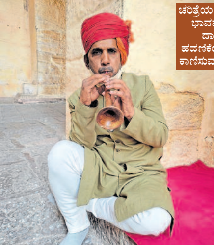
ಚರಿತ್ರೆಯ ಯಾವುದೋ ಭಾವಪೂರ್ವಕವನ್ನು ದಾಟಿಸುವ ಹವಣಿಕೆಯಲ್ಲಿರುವಂತೆ ಕಾಣಿಸುವ ಕಲಾವಿದರು