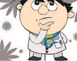
‘ಮಾನಸ ಸರೋವರ’ ದಂತಹ ಚಿತ್ರಗಳು.