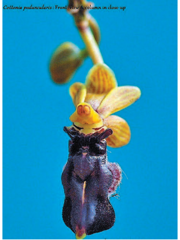
Coltonia peduncularis : Front view & column in close up

ಆರ್ಕಿಡ್ ಹೂವು ಹೆಣ್ಣು ದುಂಬಿಯ ವಾಸನೆ ಮತ್ತು ವೆಲ್ಟೆಟ್‌ನಂತಹ ಸ್ಪರ್ಶವನ್ನು ಅನುಕರಿಸುತ್ತವೆ. ಇದು ಜೀವಂತ ಕೀಟವನ್ನು ಹೋಲುತ್ತವೆ. ಇದರ ರೂಪವನ್ನು ಗಮನಿಸಿ ಹೆಣ್ಣು ದುಂಬಿ ಎಂದು ಭಾವಿಸಿದ ಗಂಡು ದುಂಬಿ ಹೂವನ್ನು ಕೂಡುತ್ತದೆ. ಆಗ ಪರಾಗಸ್ಪರ್ಶ ಕಾರ್ಯ ನಡೆಯುತ್ತದೆ. ಸಸ್ಯಗಳು ಗಾಳಿ, ನೀರಲ್ಲದೇ ಹಕ್ಕಿ, ಚಿಟ್ಟೆ, ಜೇನು ದುಂಬಿಗಳನ್ನು ಉಪಯೋಗಿಸಿಕೊಂಡು ವೈವಿಧ್ಯಮಯವಾಗಿ ಒಂದರ ಪರಾಗವನ್ನು ಬೇರೊಂದು ಹೂವಿಗೆ ಬೀರುವುದರಿಂದ ಹೂವುಗಳು ಗರ್ಭ ಕಟ್ಟಿ ತಾಯಿಯಾಗುತ್ತವೆ.