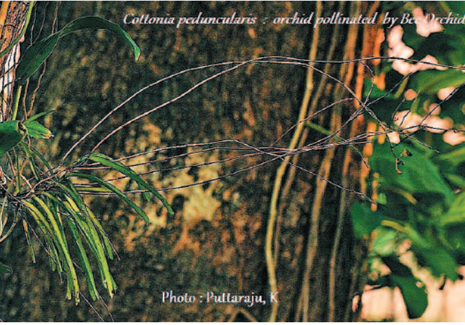
Coltonia peduncularis - orchid pollinated by Bee Orchid