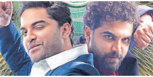
ದಾಸ್ ಕಾ ಧಮ್ಮ

'ಸೈಡ್ ಎ', 'ಸೈಡ್ ಬಿ' ಎಂದು ಎರಡು ಭಾಗಗಳಲ್ಲಿ ಬಿಡುಗಡೆಯಾಗಲಿರುವುದು ವಿಶೇಷ. ಎರಡು ತಿಂಗಳ ಅಂತರದಲ್ಲಿ ಒಂದೇ ಸಿನಿಮಾದ ಎರಡು ಭಾಗಗಳು ತೆರೆಕಂಡ ಉದಾಹರಣೆ ಇದುವರೆಗೆ ಇಲ್ಲ. ಕನ್ನಡ ಚಿತ್ರರಂಗವು ಕಥೆಗಾರರನ್ನು ಸರಿಯಾಗಿ ನಡೆಸಿಕೊಂಡಿಲ್ಲ ಎಂದು ಖುಲ್ಲಂಖುಲ್ಲಾ ಹೇಳಿರುವ ರಾಜ್ ಬಿ. ಶೆಟ್ಟಿ ಕೂಡ 'ಟೋಬಿ' ಮೊದಲ ಪೋಸ್ಟರ್ ಮೂಲಕವೇ ಸಂಚಲನ ಮೂಡಿಸಿದ್ದಾರೆ. 'ಫೋನ್ಸ್' ಸಿನಿಮಾದ ಟೀಸರ್‌ನಲ್ಲಿನ 'ಒರಿಜಿನಲ್ ಗ್ಯಾಂಗ್‌ಸ್ಟರ್' ಎಂಬ ಶಿವರಾಜ್‌ಕುಮಾರ್ ಸಂಭಾಷಣೆಗೂ ಚಪ್ಪಾಳೆ ಬೀಳುತ್ತಿದೆ. ತೆಲುಗಿನ 'ಬಲಗಂ', 'ದಾಸ್ ಕಾ ಧಮ್ಮಿ', 'ವಿರೂಪಾಕ್ಷ', ತಮಿಳಿನ 'ಪೊನ್ನಿಯನ್ ಸೆಲ್ವನ್ 2', 'ಪಾತು ತಲ', 'ಪಿಚ್ಚಿಕಾರನ್ 2', ಮಲೆಯಾಳಂನ '2018', 'ರೋಮಾಂಚನಂ', 'ಪಾಚುಂ ಅದ್ವಿತವೆಳಕಂ', 'ಇರಟ್ಟಿ' ಸಿನಿಮಾಗಳು ಗಳಿಕೆವಾರು ಯಶಸ್ಸು ದಾಖಲಿಸಿವೆ. ವಿಜಯ್ ಅಭಿನಯದ 'ವಾರಿಸು' ತೆಲುಗಿನಲ್ಲಿ ರೀಮೇಕ್ ಆಗಿ, ಅಲ್ಲಿಯೂ ಉತ್ತಮ ಗಳಿಕೆ ಮಾಡಿದೆ. 'ಪಠಾಣ್' ಕೂಡ ತೆಲುಗು, ತಮಿಳು ಡಬ್ಬ್ಡ್ ಆವೃತ್ತಿಗಳಲ್ಲೂ ಗಮನಾರ್ಹ ರೀತಿಯಲ್ಲಿ ಮಹಿಮಾಟು ನಡೆಸಿದೆ. 'ಇನ್ನು ಮುಂದೆ ನೋಡ್ತಾ ಇರಿ' ಎನ್ನುವಂತೆ ಶಾರುಖ್ ಖಾನ್ ಬೀರಿರುವ ನೋಟವು ವರ್ಷದ ಇನ್ನುಳಿದ ಅರ್ಧಭಾಗದ ಕುರಿತ ಆಶಾವಾದಕ್ಕೆ ಅರ್ಥವನ್ನಂತೂ ದಕ್ಕಿಸಿಕೊಟ್ಟಿದೆ.