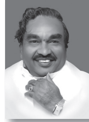
ಶ್ರೀ ಕೆ ಎಸ್ ಈಶ್ವರಪ್ಪ ಮಾನ್ಯ ಉಪ ಮುಖ್ಯಮಂತ್ರಿಯವರು ಹಾಗೂ ಗ್ರಾಮೀಣಾಭಿವೃದ್ಧಿ ಮತ್ತು ಪಂಚಾಯತ್ ರಾಜ್ ಸಚಿವರು ಕರ್ನಾಟಕ ಸರ್ಕಾರ