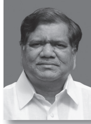
ಶ್ರೀ ಜಗದೀಶ ಶೆಟ್ಟರ್ ಮಾನ್ಯ ಮುಖ್ಯಮಂತ್ರಿಯವರು ಕರ್ನಾಟಕ ಸರ್ಕಾರ