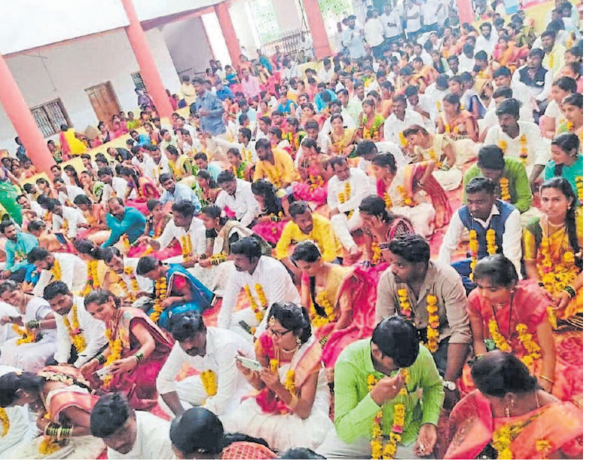
ಬುದ್ಧ, ಬಸವ, ಅಂಬೇಡ್ಕರ್ ಜಯಂತಿಗಳ ಆಚರಣೆ ನೆಪದಲ್ಲಿ ನಡೆದ ಸಾಮೂಹಿಕ ವಿವಾಹ ಕಾರ್ಯಕ್ರಮ