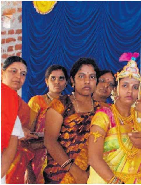
ಚಾಮರಾಜನಗರ ತಾಲ್ಲೂಕಿನ ಆಲೂರು ಗ್ರಾಮದಲ್ಲಿ ನಡೆದ 'ವಚನ ಮಾಂಗಲ್ಯ' ವಿವಾಹ