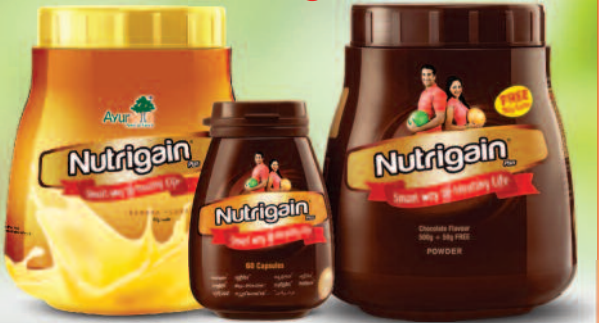
ಬನಾನಾ ಪ್ಲೇವರ್ ಕ್ಯಾಪ್ಸೂಲ್ ಚಾಕೋಲೆಟ್ ಪ್ಲೇವರ್

8880 666 666 ಭಾರತಾದ್ಯಂತ ಮೆಡಿಕಲ್ ಸ್ಟೋರ್ಸ್ ಮತ್ತು ಪ್ರಮುಖ ಸೂಪರ್ ಮಾರ್ಕೆಟ್‌ಗಳಲ್ಲಿ ಲಭ್ಯವಿದೆ