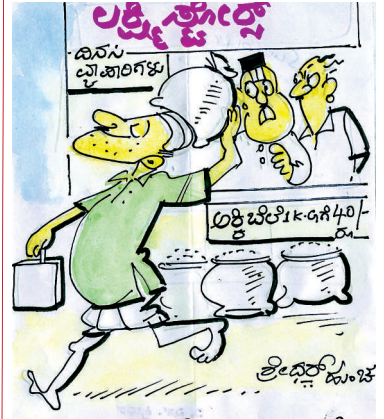
ಅವ್ವ ಧಿಮಾಕು ನೋಡು.. ಒಂದು ರೂ.ಗೆ. ಕೆಜೆ ಅಕ್ಕಿ ಸಿಗೋಕೆ ಸುರುವಾದ ಮೇಲೆ ನಮ್ಮ ಕಡೆ ತಿರುಗಿಯೂ ನೋಡ್ತಾ ಇಲ್ಲ....