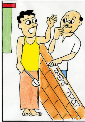
ನಮ್ಮ ನೇಲಿ ನನ್ನಾ ಕೇನೇ 'ಬಿಗ್‌ಬಾಸ್' ಮಾರಾಯ್ತಿ! ಇವತ್ತು ನನಗೆ ಅಡುಗೆ ಮಾಡುವ ಟಾಸ್ಕ್ ಕೊಟ್ಟಿದ್ದೀಳೆ!