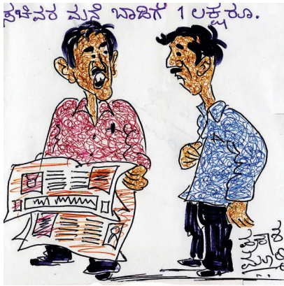
ನಾಲ್ಕಾರು ಮನೆಗಳನ್ನು ಕಟ್ಟಿಸಿ ಸಚಿವರಿಗೆ ಬಾಡಿಗೆಗೆ ನೀಡಿದರೆ ಹೇಗೆ ಅಂತ ಯೋಚನೆಯಾಗಿದೆ!