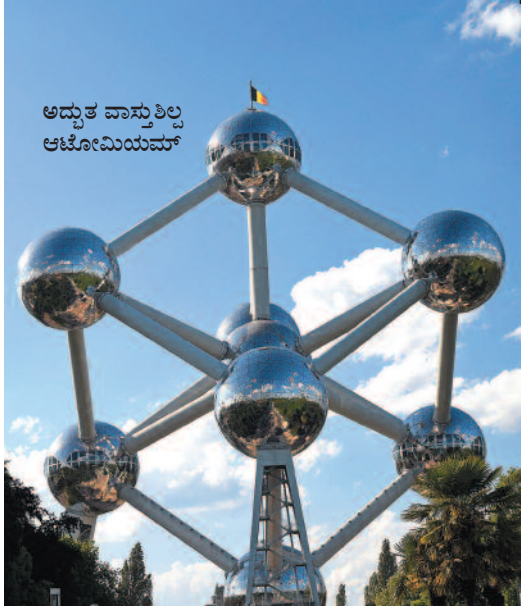
ಅದ್ಭುತ ವಾಸ್ತುಶಿಲ್ಪ ಆಟೋಮಿಯಮ್