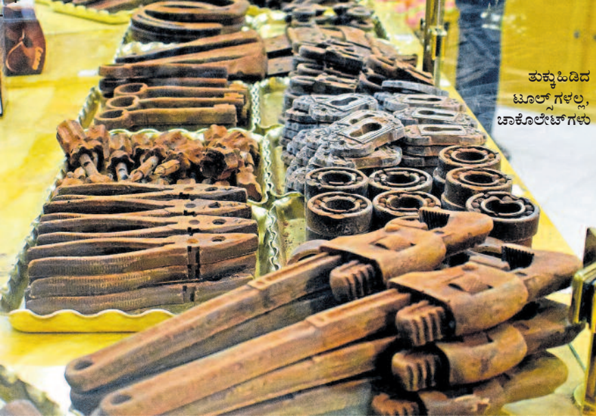
ತುಕ್ಕು ಹಿಡಿದ ಟೂಲ್ ಗಳಲ್ಲ, ಚಾಕೋಲೇಟ್ ಗಳು