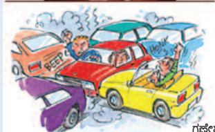
ರಕ್ತ ನಿಗದಿತ ಮಾರ್ಗದಲ್ಲೇ ಸಂಚರಿಸುತ್ತದೆ.