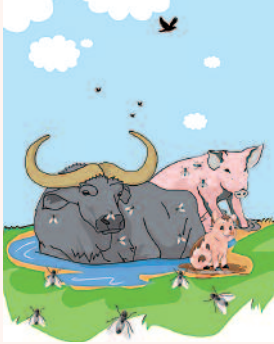
ಎಮ್ಮೆಗಳಿಗೆ, ಹಂದಿಗಳಿಗೆ, ನೋಣಗಳಿಗೆ.....