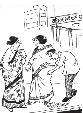
ಇವರು... ನನ್ನ.. ಹಸ್ ಬೆಂಡೂ.. ಕಣ್ಣೇ..