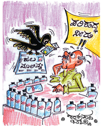
ಕುಡಿಯೋಕೆ ಒಳ್ಳೆ ನೀರು ಸಿಕ್ಕಿಲ್ಲ ಸ್ವಾಮಿ.. ದಯವಿಟ್ಟು ಒಂದು ಮಿನರಲ್ ವಾಟರ್ ಬಾಟಲಿ ಕೊಡಿ.