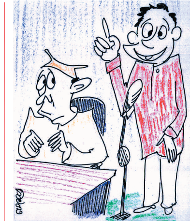
ಗಾಯಕರಿಗೆ ಹೇಗೆ ಗುರು ಪರಂಪರೆ ಇದೆಯೋ ಹಾಗೆ ಇವರಿಗೆ 'ಪಕ್ಕ ಪರಂಪರೆ' ಇದೆ. ಮೊದಲು ಕಾಂಗ್ರೆಸ್.. ಜನತಾ ಪಕ್ಷ.. ನಂತರ ಬಿಜೆಪಿ.. ದಳ.. ವಿದಳ.. ಎಲ್ಲ ಪಕ್ಷದಲ್ಲಿಯೂ ಅಭ್ಯಾಸ ಮಾಡಿದ್ದಾರೆ.