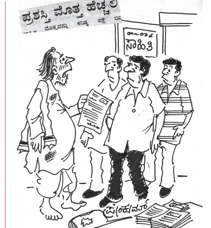
ನಿಮ್ಮ ಸಂಸ್ಥೆ ನನಗೆ ಪ್ರಶಸ್ತಿ ನೀಡಲು ನಿರ್ಧರಿಸಿರುವುದಕ್ಕೆ ಸಂತೋಷ.. ಪ್ರಶಸ್ತಿ ಮೊತ್ತ ಬಹಳ ಕಡಿಮೆ.. ಐವತ್ತು ಸಾವಿರ ಮಾಡಿದರೆ ಉಪಕಾರ..!