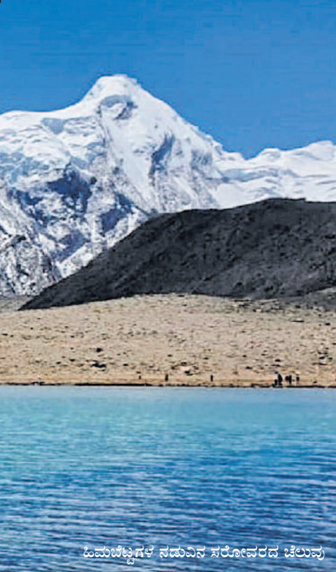
ಹಿಮಬೆಟ್ಟಗಳ ನಡುವಿನ ಸರೋವರದ ಚಿಲುಪ್ಪು

ಈ ಸರೋವರಕ್ಕೆ ಗುರು ದಂಬ ಕೊಳ ಎಂಬ ಹೆಸರೂ ಇದೆ. ಇದು ಗುರು ದಗ್ಮಾರ್ ಎನ್ನುವ ಹೆಸರಿನಿಂದ ಬಂದಿದೆ ಎನ್ನಲಾಗಿದೆ. ಇದರ ಅರ್ಥ 'ಕೆಂಪು ಮುಖದ ಗುರು' ಸಾಂಭವ ಎಂತಲೇ. ಕೆಲವರು ಗುರುನಾನಕರು ಇಲ್ಲಿಗೆ ಬಂದಿದ್ದರು ಎಂದು ನಂಬುತ್ತಾರೆ. ಇನ್ನು ಕೆಲವರು ಗುರು ರನ್ನೋಜಿಯ ಕಾರಣ ಈ ಹೆಸರು ಬಂದಿದೆಯೆಂದು ನಂಬುತ್ತಾರೆ. ಹೀಗಾಗಿ ಅಂದಿನಿಂದಲೂ ಬೌದ್ಧರು, ಸಿಖ್ಖರು ಮತ್ತು ಹಿಂದೂಗಳು ಪವಿತ್ರ ಸ್ಥಳವೆಂದು ನಂಬಿ ಈ ಕೊಳಕ್ಕೆ ನಡೆದುಕೊಳ್ಳುತ್ತಾರೆ.