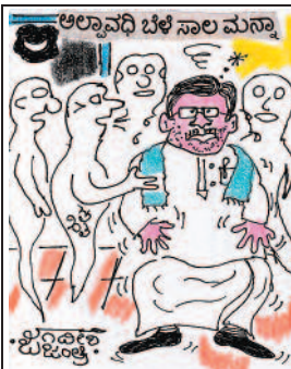
ಮೊದ್ದೇ 'ಈ ಕೆಲಸ' ಮಾಡಿದ್ದೆ... ನಾವೊಂದಿಷ್ಟು ರೈತರಾದ್ರೂ... ಬದುಕೋತಿದ್ದೆ ಬುದ್ಧಿ!