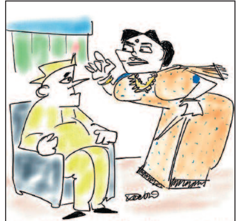
ನಿಮ್ಮ ಸುದ್ದಿಯೂ ಪೇಪರ್‌ನಲ್ಲಿ ಬರಲಿ... ಬಂದಾಗೆ ಪರವಾಗಿಯೋ ವಿರೋಧವಾಗಿಯೋ ಹೇಳಿಕೆ ಕೊಡಿ.