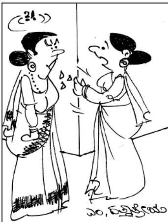
ಪ್ರತಿ ದಿನ ನನ್ನ ಮಗ 100 ರೂಪಾಯಿ 'ಜಂಕ್ ಫುಡ್' ಮತ್ತು ಒಂದು 'ಜಿಬಿ' ವೈಫೈ ತಿಂತಾನೆ...!