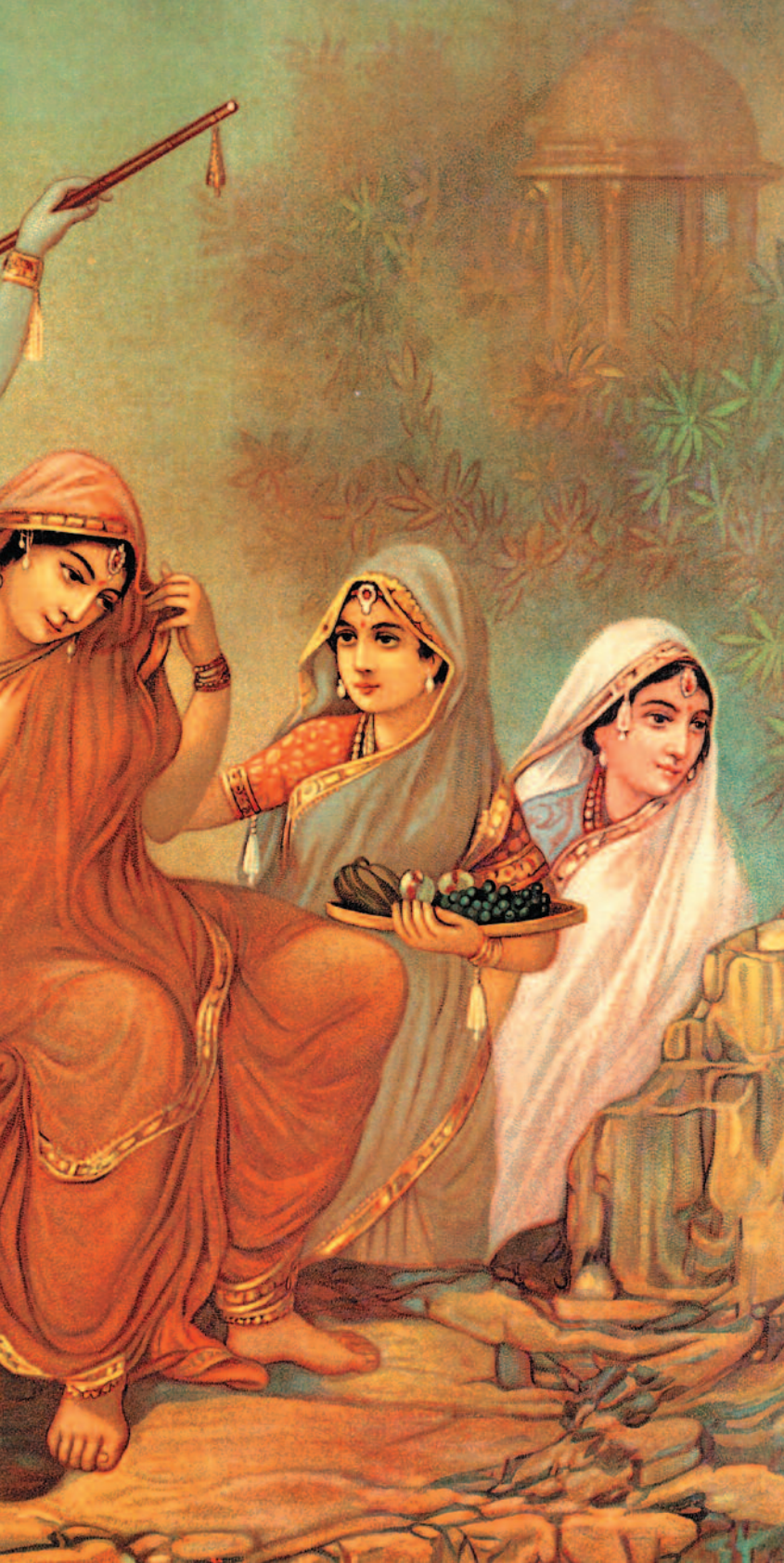
ರಾಜಾ ರವಿವರ್ಮನ ಕಲ್ಪನೆಯಲ್ಲಿ ಗೋಪಿಕೆಯರೊಂದಿಗೆ ಶ್ರೀಕೃಷ್ಣ ಕಲಾಕೃತಿ ಕೃಪೆ: 'ಪರಸರಾಮ್ ಮಂಘಾರಾಮ್' ಪ್ರಕಾಶನದ 'ರಾಜಾ ರವಿವರ್ಮ: ದಿ ಪೈಂಟರ್ ಪಿನ್'