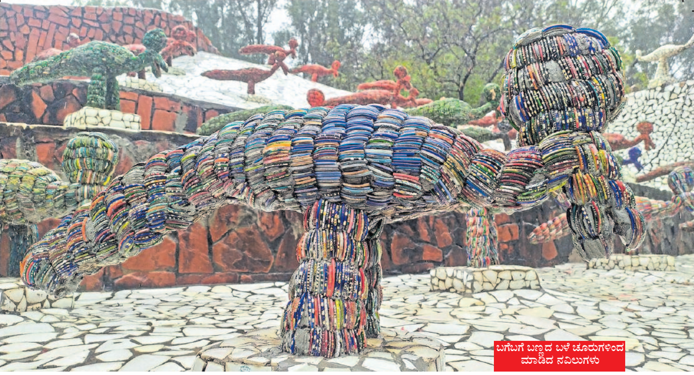
ಬಗೆಬಗೆ ಬಣ್ಣದ ಬಳೆ ಚೂರುಗಳಿಂದ ಮಾಡಿದ ನವಿಲುಗಳು