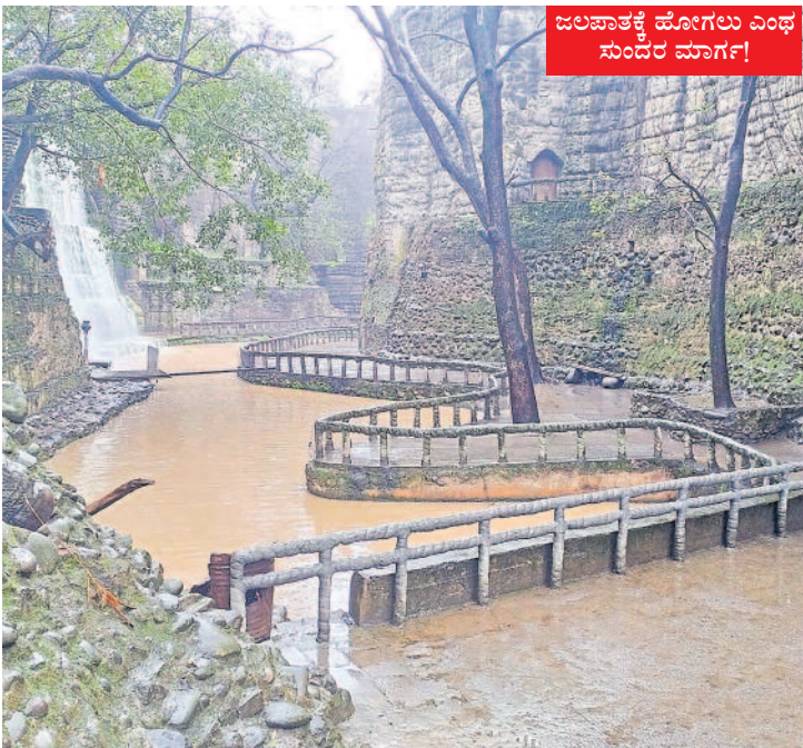
ಜಲಪಾತಕ್ಕೆ ಹೋಗಲು ಎಂಥ ಸುಂದರ ಮಾರ್ಗ!

ತೆರವುಗೊಳಿಸಿದ ಕಟ್ಟಡಗಳ ಅವಶೇಷಗಳನ್ನು ಸಂಗ್ರಹಿಸಲು ಚಾಂದ್ ಶುರು ಮಾಡಿದರು. ಸುಖ್ನಾ ಸರೋವರದ ದಡದಲ್ಲಿ ಇದ್ದ ಅರಣ್ಯಕ್ಕೆ ಯಾರಿಗೂ ತಿಳಿಯದಂತೆ ಅವುಗಳನ್ನು ತಂದು ಹಾಕಿದರು (1958). ಆದರೆ ಆ ಅರಣ್ಯದ ಜಾಗದಲ್ಲಿ ಯಾವುದೇ ನಿರ್ಮಾಣ ಕಾಮಗಾರಿ ಕೈಗೊಳ್ಳಬಾರದು ಎಂದು 1902ರಲ್ಲಿಯೇ ಆದೇಶ ಹೊರಡಿಸಲಾಗಿತ್ತು. ಹಾಗಿದ್ದರೂ ಯಾವುದೋ ಧೈರ್ಯದಿಂದ ನೆಕ್ ಚಾಂದ್ ಅವರು ತ್ಯಾಜ್ಯದಿಂದ ಒಂದೊಂದು ಬಗೆಯ ಕಲಾಕೃತಿಗಳನ್ನು ರಚಿಸಲು ಆರಂಭಿಸಿದರು. ಪ್ರತಿಬಂಧಿಸಿದ ಪ್ರದೇಶದಲ್ಲಿ ಯಾವುದೇ ಕಾಮಗಾರಿ ಮಾಡುವುದು ನಿಷೇಧಿಸಿದ್ದರಿಂದ, ಚಾಂದ್ ಅವರ ಕೆಲಸ 'ಅಕ್ರಮ'ವಾಗಿತ್ತು. ಅವರ ನಿರ್ಮಾಣ ಕಾರ್ಯ ಒಂದೆರಡಲ್ಲ; ಸತತ 18 ವರ್ಷಗಳ ಕಾಲ ರಹಸ್ಯವಾಗಿ ನಡೆಯಿತು.