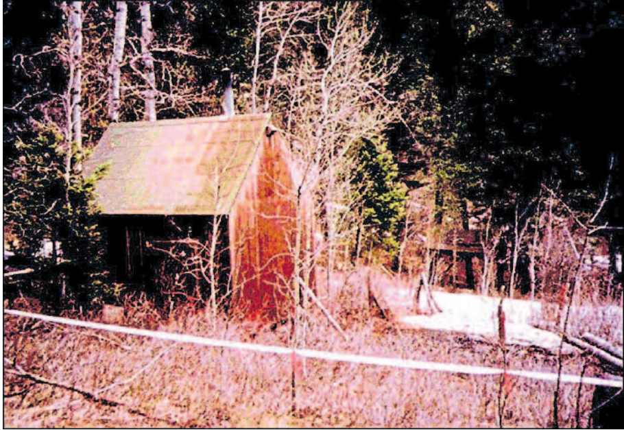
ಟೆಡ್‌ಗೆ ಕಾಡಿನಲ್ಲಿ ಆಸರೆ ನೀಡಿದ್ದ ಪುಟ್ಟ ಶೆಡ್

ಚಿಕ್ಕ ಗುಡಿಸಲನ್ನು ಕಟ್ಟಿಕೊಂಡ. ವಾರಾಂತ್ಯದಲ್ಲಿ ಬೈಸಿಕಲ್‌ನಲ್ಲಿ ಬೆಳೆಗೆ ಹೋಗಿ ತನಗೆ ಬೇಕಾದ ಕನಿಷ್ಠ ದಿನಸಿಯನ್ನು ಕೊಂಡುತರುತ್ತಿದ್ದ. ಇಂಟರ್‌ನೆಟ್ ಹಾಗಿರಲಿ, ಕಂಪ್ಯೂಟರ್ ಕೂಡ ಇಲ್ಲದ ಆ