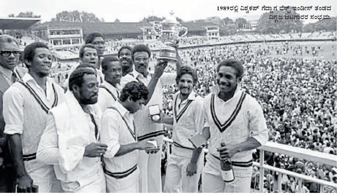
1989ರಲ್ಲಿ ವಿಶ್ವಕಪ್ ಗೆದ್ದಾಗ ವೆಸ್ಟ್ ಇಂಡೀಸ್ ತಂಡದ ದಿಗ್ಗಜ ಆಟಗಾರರ ಸಂಭ್ರಮ.