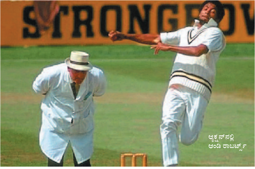
ಒಕ್ಕನಿನಲ್ಲಿ ಆಂಡಿ ರಾಬರ್ಟ್ಸ್

ಎರಡನೇ ವಿಶ್ವಯುದ್ಧಕ್ಕೆ ಮೊದಲು ಜಾರ್ಜ್ ಹೆಡ್ಲಿ ವೆಸ್ಟ್‌ಇಂಡೀಸ್ ತಂಡದ ನಾಯಕ ಆಗಿದ್ದರು. ಅವರಾದ ಮೇಲೆ ಒಂದು ದಶಕಕ್ಕೂ ಹೆಚ್ಚು ಅವಧಿ ವಿಂಡೀಸ್ ತಂಡದವರು ಬಿಳಿ ಬಣ್ಣದ ನಾಯಕರ ಅಡಿಯೇ ಆಡುತ್ತಿದ್ದರು. ಫ್ರಾಂಕ್ ವೋರೆಲ್ 1960ರ ದಶಕದಲ್ಲಿ ತಂಡದ ಎರಡನೇ ಕಪ್ಪು ಬಣ್ಣದ ನಾಯಕ ಎನಿಸಿಕೊಂಡರು. ಜಮ್ಮಕಾದ ಸೆನೆಟರ್ ಕೂಡ ಆಗಿದ್ದ ಅವರು ಬಲಗೈ ಬ್ಯಾಟ್ಸ್ಮನ್, ಎಡಗೈ ವೇಗದ ಬೌಲರ್. ಇಂಗ್ಲೆಂಡ್‌ನ ಕೌಂಟಿ ಕ್ರಿಕೆಟ್‌ನಲ್ಲಿ ಆಟದ ಕೌಶಲಗಳನ್ನು ಚೆನ್ನಾಗಿ ಕಲಿತುಕೊಂಡು ಬಂದಿದ್ದರು. ಆಸ್ಟ್ರೇಲಿಯಾ, ಇಂಗ್ಲೆಂಡ್, ಭಾರತ ತಂಡಗಳ ಎಂದು 15 ಟೆಸ್ಟ್‌ಗಳಲ್ಲಿ ಅವರು ತಂಡವನ್ನು ಮುನ್ನಡೆಸಿದ್ದರು. ಆ ಪೈಕಿ ಒಂಬತ್ತರಲ್ಲಿ ಗೆಲುವು ಒಲಿದಿತ್ತೆನ್ನುವುದು ಅವರ ಕೌಶಲಕ್ಕೆ ಕನ್ನಡಿ. ಅವರ ನಂತರ ಗ್ಯಾರ್‌ಫೀಲ್ಡ್ ಸೋಬರ್ಸ್ 39 ಟೆಸ್ಟ್‌ಗಳಲ್ಲಿ ನಾಯಕರಾಗಿ, ಒಂಬತ್ತು ಗೆಲುವು ತಂದಿತ್ತರು. 10 ಸಲ ಸೋಲು ಎದುರಾಗಿತ್ತು. ಆಮೇಲೆ ರೋಹನ್ ಕನ್ಹಾಯ್ 13 ಟೆಸ್ಟ್‌ಗಳಲ್ಲಿ ನಾಯಕನ ನೊಗ ಹೊತ್ತರು. ಎರಡು ಮೂರು ವರ್ಷಗಳ ಆ ಅಲ್ಪಾವಧಿಯಲ್ಲಿ ವಿಂಡೀಸ್ ಗೆದ್ದಿದ್ದು ಮೂರು ಟೆಸ್ಟ್. ಸೋತದ್ದೂ ಅಷ್ಟೇ ಪಂದ್ಯಗಳಲ್ಲಿ. ಡ್ರಾ ಆದ ಪಂದ್ಯಗಳ ಸಂಖ್ಯೆ ಏಳು. ಕ್ಲೈವ್ ಲಾಯ್ಡ್ 1974ರಲ್ಲಿ ತಂಡದ ನಾಯಕರಾದರು. 85ರವರೆಗೆ ದೀರ್ಘಾವಧಿ ಅವರದ್ದೇ ಗರಡಿ. 79 ಟೆಸ್ಟ್‌ಗಳಲ್ಲಿ 36ರಲ್ಲಿ ಗೆಲುವು. ಸೋತಿದ್ದು ಬರೆ 12ರಲ್ಲಿ. ವಿವಿಯನ್ ರಿಚರ್ಡ್ಸ್ ಕೂಡ 1980ರಿಂದ 1991ರವರೆಗೆ ಟೆಸ್ಟ್ ನಾಯಕರಾಗಿ 50 ಪಂದ್ಯಗಳಲ್ಲಿ 27ನ್ನು ಗೆಲ್ಲಿಸಿಕೊಟ್ಟರು. ಸೋತದ್ದು