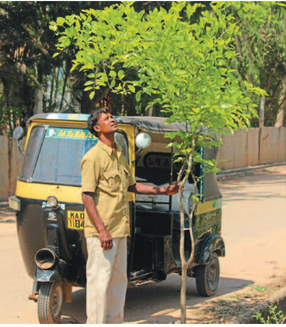
ತಾನೇ ನೆಟ್ಟ ಹೊಗೆಯ ಗಿಡವನ್ನು ಕಣ್ತುಂಬಿಕೊಳ್ಳುತ್ತಿರುವ ಆಟೋ ಚಾಲಕ