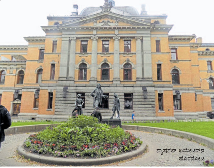
ನ್ಯಾಷನಲ್ ಥಿಯೇಟರ್‌ನ ಹೊರನೋಟ