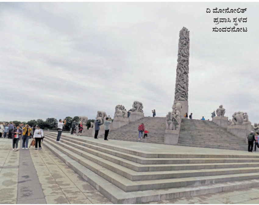
ದಿ ಮೋನೋಲಿತ್ ಪ್ರವಾಸಿ ಸ್ಥಳದ ಸುಂದರನೋಟ