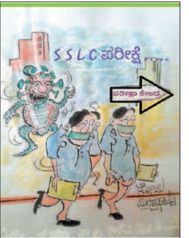
ಹೇ... ಹುಡುಗ್ರಾ ನಿಲ್ಲೋ ನಾನೂ ಬರ್ತೀನಿ...!