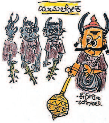
ಭೂಲೋಕದಲ್ಲಿ ಯಾರು ಯಾರು ಮಾಸ್ಕಾ ಹಾಕದೆ ಓಡಾಡುತ್ತಿದ್ದಾರೋ ಅವರನ್ನು ಇಲ್ಲಿಗೆ ಕರೆದು ತನ್ನಿ!