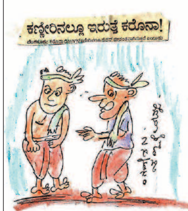
ಇನ್ನು ನೋವನ್ನು ನುಂಗಿಕೊಂಡು ಮನಸ್ಸಿನಲ್ಲೇ ಅಳಬೇಕು ಕಣೋ...