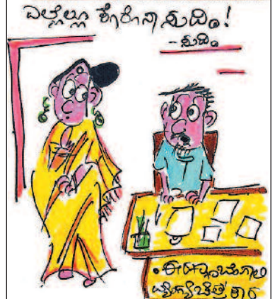
ಕೊರೊನಾ ಬಿಟ್ಟು ಬೇರೆ ಯಾವ ವ್ಯಂಗ್ಯ ಚಿತ್ರಗಳನ್ನು ರಚಿಸಬೇಕು ಅಂಥ ತಿಳೀತಾ ಇಲ್ಲ ಕಣೇ!