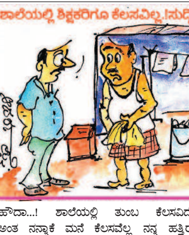
ಹೌದಾ...! ಶಾಲೆಯಲ್ಲಿ ತುಂಬ ಕೆಲಸವಿದೆ ಅಂತ ನನ್ನಾಕೆ ಮನೆ ಕೆಲಸವೆಲ್ಲ ನನ್ನ ಹತ್ತಿರ ಮಾಡಿಸಿಕೊಳ್ಳುತ್ತಾಳೆ ಕಣೋ...!