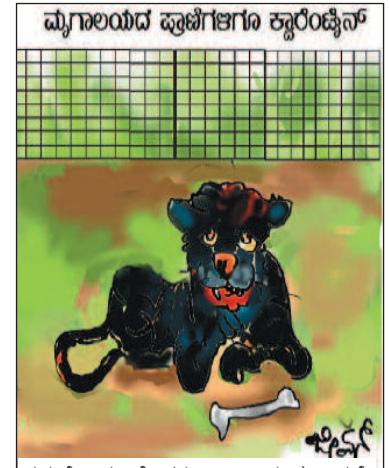
ನಮಗೆ ಇದು ಹೊಸತಲ್ಲ...! ನಾವು ಈಗಾಗಲೇ ಹಲವು ವರ್ಷಗಳಿಂದ ಕ್ವಾರಂಟೈನ್‌ನಲ್ಲಿ ಇದ್ದೇವೆ!