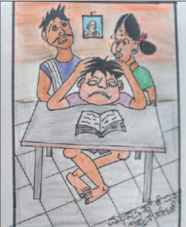
ಪರೀಕ್ಷೆಗೆ ಎಷ್ಟೇ ಮನನ ಮಾಡಿದರೂ ನೆನಪಿಗೆ ಕೊರೊನಾ ಬಿಟ್ಟೆ ಮತ್ತೇನೂ ಬರ್ತಾ ಇಲ್ಲ ಅಂತೆ!