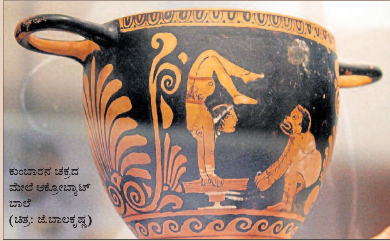
ಕುಂಬಾರನ ಚಕ್ರದ ಮೇಲೆ ಆಕ್ರೋಬ್ಯಾಟ್ಸ್ ಬಾಲೆ

ಗ್ರೀಕ್ ನಾಗರಿಕತೆ ಉತ್ತುಂಗದಲ್ಲಿದ್ದಾಗ ಅಲ್ಲಿನ ಸಾಮಾನ್ಯ ಜನರ ಬದುಕು, ಸಂಸ್ಕೃತಿಯನ್ನು ಪರಿಚಯಿಸುವ ಚಿತ್ರಗಳ ಮೂಲಕ ಹಾಗೂ ಬದುಕಿನ ಮತ್ತೊಂದು ಮುಖವಾದ ವ್ಯಂಗ್ಯ, ಲೇವಡಿಯನ್ನು ಮನೋಛಾಸದಿಂದ ಪರಿಚಯಿಸುವ ಗ್ರೀಕ್‌ನ ಮಡಕೆ ಕುಡಿಕೆಗಳು ಇಂದು ಜಗತ್ತಿನಾದ್ಯಂತ ವಸ್ತುಸಂಗ್ರಹಾಲಯಗಳಲ್ಲಿವೆ. ಈ ರೀತಿಯ ಅಧ್ಯಯನಕ್ಕೊಳಪಡದ ಸಾವಿರಾರು ಕುಂಬಾರಿಕೆ ವಸ್ತುಗಳು ಉಗ್ರಾಣಗಳಲ್ಲಿವೆ. ವಿದ್ವಾಂಸರಿಗೆ ಇಂದಿಗೂ ಈ ರೀತಿಯ ವಸ್ತುಗಳು ತಮ್ಮ ಉತ್ಪನ್ನದಲ್ಲಿ ದೊರಕುತ್ತಲೇ ಇವೆ.