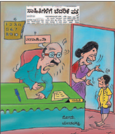
ಬೆದರಿಕೆ ಪತ್ರ ಬರುವಷ್ಟು ಸಾಹಿತಿ ಅಲ್ಲ ಕಣೋ ನಿಮ್ಮ ಅಪ್ಪ. ಸುಮ್ಮನೆ ಸಣ್ಣ ಪುಟ್ಟದ್ದು ಬರ್ಕೊಂಡು ಸಾಹಿತಿ ಅಂತ ಬೋರ್ಡ್ ಹಾಕಿಕೊಂಡಿದ್ದಾರೆ!