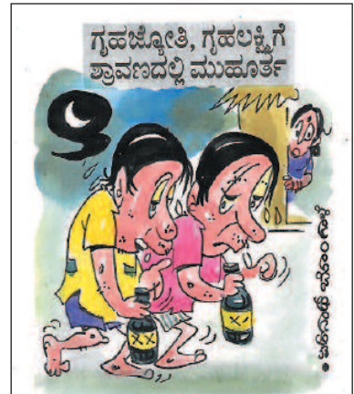
ಅಂತೂ ನಮ್ಮ ನಮ್ಮ ಹೆಂಡತಿಯರಿಂದ ಹಣ ಕಿತ್ತುಕೊಳ್ಳೋಕೆ ಶ್ರಾವಣದವರೆಗೂ ಕಾಯಬೇಕು ಅನ್ನು!