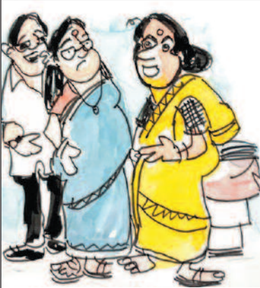
ಉಚಿತ ಬಸ್ ಹತ್ತಿ ಪ್ರಯಾಣ ಮಾಡಲು ನುಗ್ಗಿ ಸೀಟು ಹಿಡಿಯಲು ಶಕ್ತಿ ಇರಬೇಕು ಕಣ್ರೀ. ಬರೀ 'ಸ್ತ್ರೀ ಶಕ್ತಿ' ಯೋಜನೆ ಸಾಕಾಗಲ್ಲ. 'ಅನ್ನ ಶಕ್ತಿ'ಯೂ ಬೇಕು.