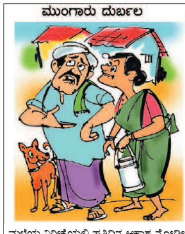
ಮಳೆಯ ನಿರೀಕ್ಷೆಯಲ್ಲಿ ಪ್ರತಿದಿನ ಆಕಾಶ ನೋಡಿ ನೋಡಿ ಕತ್ತು ತಿರುಗಿ ಹೋಗಿದೆ!