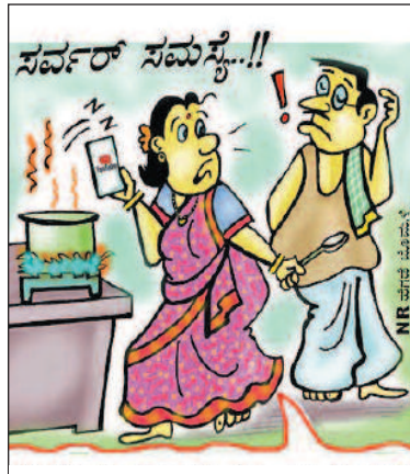
ತಡೀರಿ, ಇನ್ನೂ ಅಡುಗೆ ಆಗಿಲ್ಲ. ಯೂಟ್ಯೂಬ್ ನೋಡ್ತಾ ಅಡುಗೆ ಮಾಡ್ತಿದ್ದೇನೆ. ನೆಟ್ ಪ್ರಾಬ್ಲಂನಿಂದ ಅರ್ಧಕ್ಕೆ ನಿಂತು ಹೋಗಿದೆ!