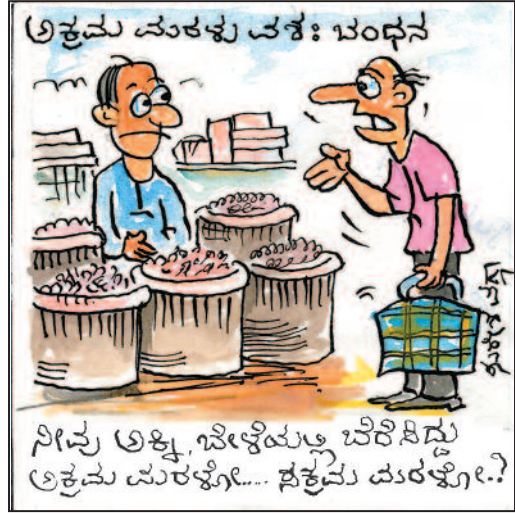
ಅಕ್ಕಮ ದುರಳು ತತಃ ಚಂಧನ

ನೀವು ಅಕ್ಕಿ, ಜೇಳಿಯಲ್ಲು ಬೆರೆಸಿದ್ದು ಅಕ್ಕಮ ದುರಳೋ... ಸಕ್ಕಮ ದುರಳೋ?!