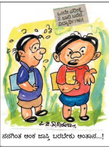
ಒಂದೇ ಪರಿತ್ಯೆ, 2 ಬಾರಿ ಬರೆದ ವಿದ್ಯಾರ್ಥಿಗಳು!

ಸಾರ್ ಅವು ಗಂಡ ಹೆಂಡ್ತಿ... ಸಾಲ ಮನ್ನಾ ಆಗುತ್ತೆ.. ಆಗಲ್ಲ ಅಂತ ಜಗಳ ಮಾಡ್ಕೊಂಡು ಬಂದಿದಾರೆ, ಏನ್ ಹೇಳ್ಲಿ ಸಾರ್...!