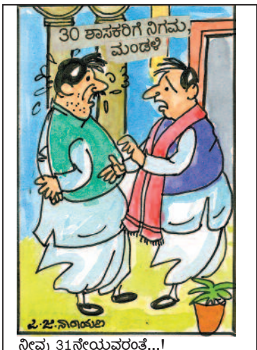
30 ಶಾಸಕರಿಗೆ ನಿಗಮ ಮಂಡಳಿ