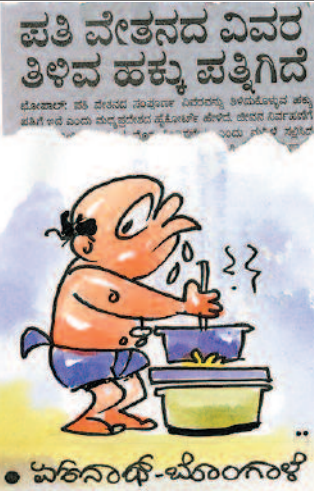
ಪತಿ ವೇತನದ ವಿವರ ತಿಳಿವ ಹಕ್ಕು ಪತ್ತಿಗಿದೆ