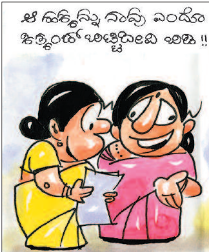
ಛೇ ಹಕ್ಕೊನ್ನಿ ನಂವು ಎಂದೊ ಹಿಕ್ಕೊಂಡ್ ಅಚ್ಚಿರಿಲಿಡಿ ಅಚ್ಚಿ !!

ನೀವು ಅಕ್ಕಿ, ಜೇಳಿಯಲ್ಲು ಬೆರೆಸಿದ್ದು ಅಕ್ಕಮ ದುರಳೋ... ಸಕ್ಕಮ ದುರಳೋ?!