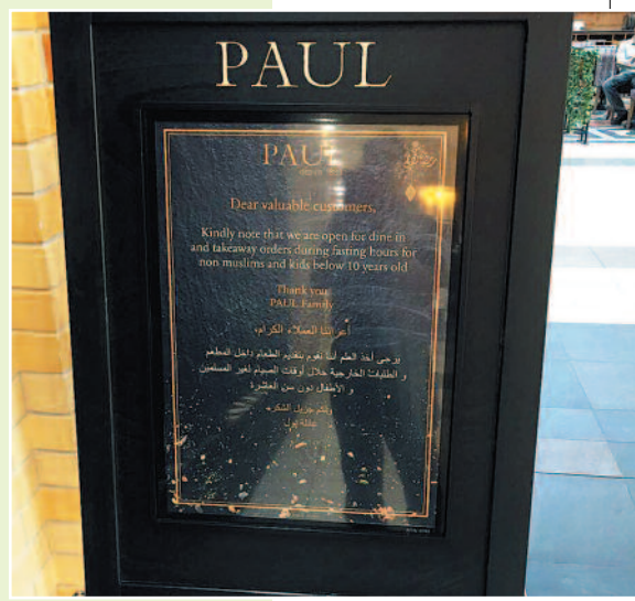
ರಂಜಾನ್ ತಿಂಗಳಲ್ಲಿ ಆಹಾರ

ಫ್ಲಾಟ್‌ಗಳಲ್ಲಿ ಹೊರಗೆ ಕಾಣುವಂತೆ ಬಟ್ಟೆ ಒಣಗಿಸಿದರೆ ದುಬೈಯಲ್ಲಿ ಪೊಲೀಸ್ ರೈಡ್ ನಡೆಯುತ್ತದೆ! ಆದರೆ ನಾವು ಬರ್‌ದುಬೈನಲ್ಲಿ ಓಡಾಡುತ್ತಿದ್ದಾಗ ನಾಲ್ಕನೇ ಮಹದಿಯಲ್ಲಿ ಬಟ್ಟೆ ಒಣಹಾಕಿದ್ದು ಕಂಡು ಬಂತು. ಈ ಪ್ರದೇಶದಲ್ಲಿ ಭಾರತೀಯರು ಹೆಚ್ಚಿನ ಸಂಖ್ಯೆಯಲ್ಲಿದ್ದಾರೆ!