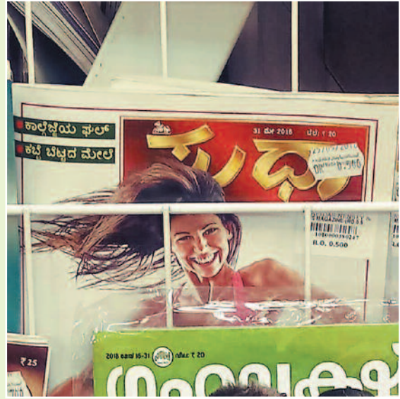
ಓಮನ್‌ನಲ್ಲಿ ಸುಧಾ ವಾರಪತ್ರಿಕೆ