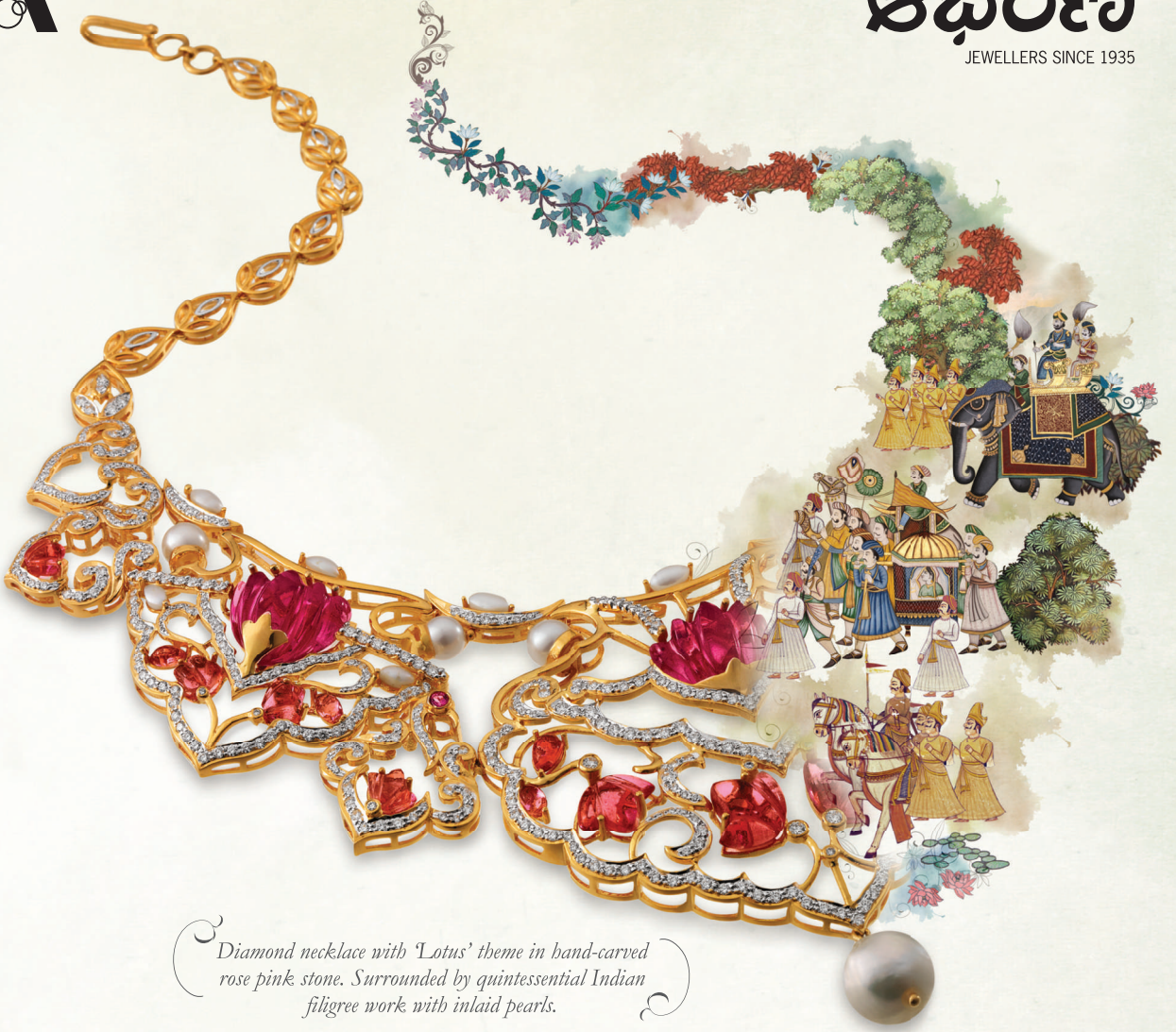
Diamond necklace with 'Lotus' theme in hand-carved rose pink stone. Surrounded by quintessential Indian filigree work with inlaid pearls.