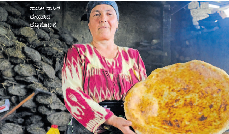
ತಾಜಿಕೀ ಮಹಿಳೆ ಬೇಯಿಸಿದ ಜೆಡ್ಡೆನೊಟ್ಟಿಗೆ