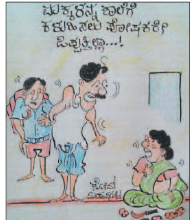
ಶಾಲೆಗೆ ಕಳಿಸಲ್ಲ ಅಂತ ಗೊತ್ತಿದ್ದೂ... ಶಾಲೆಗೆ ಹೋಗ್ತೀನಿ ಅಂತ ಹಟ ಮಾಡಿದ್ದಾನೆ ನೋಡೆ ನಿನ್ನಗ...!