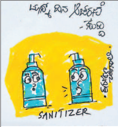
ಸ್ಯಾನಿಟೈಸರ್ ದಿನಾಚರಣೆ ಆಚರಿಸುವಂತೆ ನಾವು ಒತ್ತಾಯಿಸೋಣ...