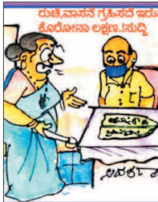
ಹಾಕೊಂಡಿರುವ ಮಾಸ್ಕ್ ತೆಗೆದರೆ ರುಚಿ, ವಾಸನೆ ಗೊತ್ತಾಗೋದು ಕಷ್ಟೇ... ಹಾಕೊಂಡಿದ್ದೆ ಅಲ್ಲ...!