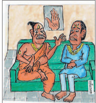
ಏನಿಲ್ಲ... ಈ ಕೊರೋನಾ ಬಂದ ಮೇಲೆ ಜನ ಭವಿಷ್ಯ ಕೇಳಲು ಬರ್ತಾ ಇಲ್ಲ. ಈಗ ನಮ್ಮ ಭವಿಷ್ಯವೇ ಮೂರಾಬಟ್ಟೆ ಆಯಿತು!