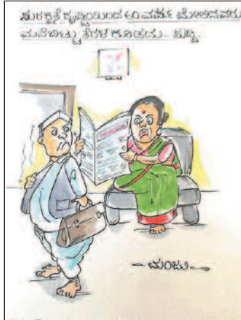
ಏನಂದ್ರಿ... ನೀವು ಇನ್ನು ಮನೆ ಬಿಟ್ಟು ಹೊರಗಡೆ ಹೋಗುವಾಗಲಿಲ್ಲ!